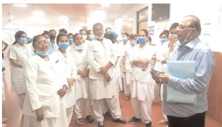
नर्सिंग यूनिट की स्टाफ नर्सों जल्दी भर्ती करने की मांग प्रबंधक कक्ष के समीप की नारेबाजी