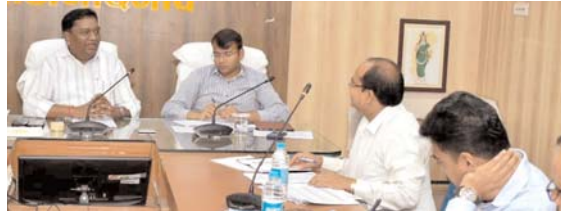
कृषि समूह और रीपा योजना की कलेक्टर ने की समीक्षा, रीपा योजना अंतर्गत चिन्हित गौठान में नर्सरी करें तैयार

○ प्रत्येक गौठान बने आजीविका मूलक गतिविधियों का विकसित केंद्र ○ गोबर पेंट यूनिट लगाने के लिए कहा