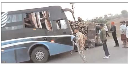
ट्रेक्टर-टॉली को टक्कर मार दी। टक्कर इतनी जोरदार थी कि लकड़ी से भरी टॉली अलग होकर बस के आगे फंस गई। इससे बस के केबिन में लगा

जानकारी के मुताबिक, महाराष्ट्र के महेंद्रा ट्रेक्टर्स की बस अमरावती से रायपुर जा रही थी। इसी दौरान राजनांदगांव में सुबह करीब 6-7 बजे ग्राम कोहका के पास नेशनल हाईवे-53 पर बस ने आगे लकड़ी लेकर जा रहे