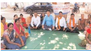
महिलाओं के हड़ताल से अनेक योजनाएं ठप्प

डोंगरगांव (दावा)। राष्ट्रीय ग्रामीण आजीविका मिशन बिहान की महिला कार्यकर्ताएं विगत माह से अपने विभिन्न मांगों को लेकर जनपद कार्यालय परिसर में अनिश्चितकाली धरना प्रदर्शन कर रहे हैं। वहीं इन महिलाओं के हड़ताल को लेकर अब