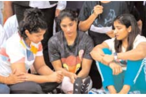
क्याम न होने दें कि अदालत के कहने के बावजूद प्राथमिकी दर्ज नहीं की गई। पीठ ने मेहता की दलीलों का संज्ञान लिया है। इसके साथ कहा कि दिल्ली पुलिस 28 अप्रैल को पहलवानों की याचिका पर सुनवाई के दौरान प्राथमिकी दर्ज करने को लेकर अपने विचार रख सकती है। आपको बता दें कि शीर्ष अदालत ने सात महिला पहलवानों की याचिका पर मंगलवार को दिल्ली पुलिस और अन्य को नोटिस जारी किया था। न्यायालय ने महिला पहलवानों द्वारा लगाये गये यौन उत्पीड़न के आरोपों को गंभीर बताया है। यह कि इस पर उसे (न्यायालय) को विचार करने की जरूरत है। (शेष पृष्ठ 6 पर...)

नई दिल्ली। दिल्ली पुलिस ने बुधवार (26 अप्रैल) को सुप्रीम कोर्ट में कहा कि भारतीय कुश्ती महासंघ (डब्ल्यूएफआई) के अध्यक्ष बृजभूषण शरण सिंह के खिलाफ सात महिला पहलवानों की ओर से लगाए गए यौन उत्पीड़न के आरोपों पर प्रारंभिक दर्ज करने से पहले प्रारंभिक जांच की जरूरत है। चीफ जस्टिस ऑफ इंडिया (सीजेआई) डीवाई चंद्रचूड़ और जस्टिस पीएस नरसिम्हा को पीठ को दिल्ली पुलिस की ओर से पेश हुए सॉलिसिटर जनरल तुषार मेहता ने बताया कि अगर सुप्रीम कोर्ट को लगता है कि सीधे