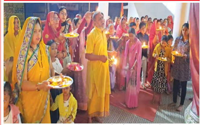
राजनांदगांव (दावा)। रामलला की प्राण प्रतिष्ठा के पूर्व शहर के श्री गणेश मंदिर मिथिला धाम में महाआरती का आयोजन किया गया।