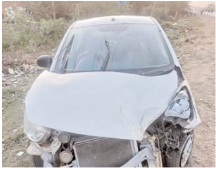
एक्सिडेंट के धाराओं सहित धारा 185 मोटर व्हीकल एक्ट में की गई कार्यवाही

राजनांदगांव (दावा)। शहर के थाना क्षेत्रों में शराब पीकर रोड एक्सिडेंट करने वालों पर पुलिस सख्त हो गई है, और पुलिस द्वारा इन पर जुर्माने से लेकर कड़ी कार्रवाई करने से बाज नहीं आ रही। बता दें कि पुलिस द्वारा जहां रोड एक्सिडेंट की घाटाओं सहित 185 मोटर व्हीकल एक्ट के तहत कार्रवाई की गई है वहीं रोड एक्सिडेंट के दौरान पार्टी से लड़ाई झगड़ा पर आमदा होने पर पृथक से धारा 151 दफ्त के तहत की प्रतिबंधात्मक कार्रवाही भी किया गया है।