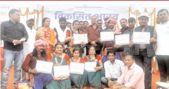
अंतिम दिन लखौली स्कूल में आयोजित शिविर में उमड़ी भीड़

योजनाओं के लाभार्थियों को चेक, आयुष्मान कार्ड व ई-श्रम कार्ड तथा उज्ज्वला योजना का गैस चुल्हा का वितरण किया। इसके पूर्व भारत को 2047 तक आत्मनिर्भर और विकसित राष्ट्र बनाने पूर्व सांसद श्री यादव ने संकल्प दिलाया। शिविर में पूर्व सांसद मधुसूदन यादव ने अपने संबोधन में कहा कि केन्द्र सरकार की हितग्राही मूलक योजनाओं के बारे में देश के हर व्यक्ति को जानकारी देने एवं उसका लाभ देने तथा जिन हितग्राहियों ने योजना का लाभ उठाया है उनका अनुभव साझा करने विकसित भारत संकल्प यात्रा निकाली गयी है। उन्होंने कहा कि निगम सीमाक्षेत्र में चार दिनों से यात्रा विभिन्न वार्डों में घूम रही है, जहाँ शिविर के माध्यम से केन्द्र सरकार की योजनाओं की जानकारी दी जा रही है और लोगों में इसके प्रति भारी उत्साह है यह आज लखौली में आयोजित अंतिम शिविर में दिख रहा है। उन्होंने कहा कि लोगों को जानकारी देकर हर योजना का लाभ दिया जायेगा एवं नागरिकों को जब हितग्राही मूलक योजना का लाभ मिलेगा तभी मोदी जी के 2047 तक आत्मनिर्भर और विकसित भारत का सपना साकार होगा। उन्होंने कहा कि शिविर में आये सभी