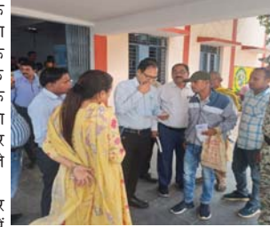
बम्हनी समिति प्रबंधक के खिलाफ जांच कर कार्यवाही की मांग

छुरिया (दवा)। एक दिवसीय प्रवास पर छुरिया पहुंचे जिला कलेक्टर के समक्ष बम्हनी क्षेत्र के किसानों ने समिति प्रबंधक पर दुर्व्यवहार करने का आरोप लगाते हुए जांच कर कार्यवाही की मांग करते हुए ज्ञापन सौंपा है।