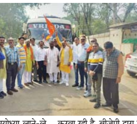
झंडी दिखाकर बसों को रवाना किया। यह विशेष रेलगाड़ी दुर्ग रेलवे स्टेशन से अयोध्या के लिए रवाना हुई है।

राजनांदगांव (दवा)। अयोध्या के रामलला की प्राण प्रतिष्ठा के बाद बीजेपी के नेतृत्व में देशभर से राम भक्त अयोध्या दर्शन हेतु जा रहे हैं, हर राज्य से अयोध्या के लिए विशेष रेलगाड़ियों का इंतजाम किया गया है। यात्रियों को अयोध्या लाने-ले जाने और वहां ठहरने आदि की व्यवस्था पार्टी द्वारा की जा रही है।