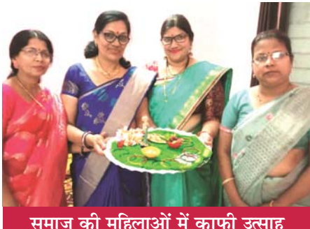
समाज की महिलाओं में काफी उत्साह

राजनांदगांव (दावा)। महाराष्ट्रीयन समाज की विवाहित महिलाओं द्वारा हल्दी कुमकुम का पर्व बड़े उत्साह के साथ मनाया जा रहा है। इस दौरान सुहागिन महिलाएं एक स्थान पर एकत्रित होकर एक-दूसरे को हल्दी कुमकुम लगाकर शांति की दीर्घायु एवं सुख-शांति की कामना करती हैं।