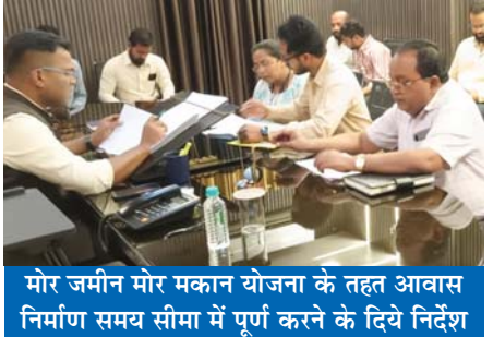
मोर जमीन मोर मकान योजना के तहत आवास निर्माण समय सीमा में पूर्ण करने के दिये निर्देश