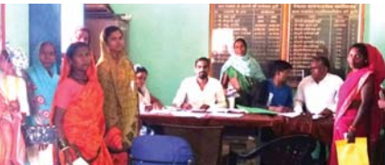
भाजपा कार्यकर्ताओं व पंचायत प्रतिनिधियों का जनहित में किया गया प्रयास

डोंगरगढ़ (दावा)। छत्तीसगढ़ में विधानसभा चुनाव के दौरान भाजपा द्वारा महिलाओं को आर्थिक समृद्धि प्रदान करते हुए सशक्त बनाने के लिए मोदी जी की गारंटी के रूप में छत्तीसगढ़ में महिलाओं के लिए अपने जन घोषणा पत्र में महतारी वंदन योजना को शामिल किया गया था।