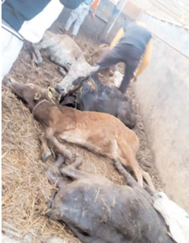
04/एनआर 9681 के चालक द्वारा ट्रक में अवैध रूप से मवेशियों को दुस-दुस कर निर्दयता पूर्वक भरकर कल्लखाना धमधा की ओर से डोंगरगढ़ होते हुये नागपुर ले जा

बिना चारा-पानी के कूरता पूर्वक ट्रक में भरकर ले जा रहे थे 34 नग मवेशी ग्रामीणों एवं पुलिस के संयुक्त घेराबंदी से पकड़ा गया मवेशियों से भरा ट्रक