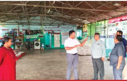
सफाई कर्मियों से की चर्चा, कार्य करने का समय व उपस्थिति की ली जानकारी