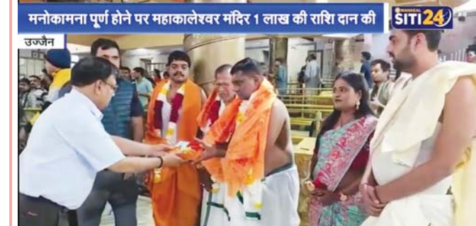
मनोकामना पूर्ण होने पर महाकालेश्वर मंदिर 1 लाख की राशि दान की