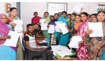
0 महतारी वंदन योजना अंतर्गत फार्म भरने के लिए बड़ी संख्या में महिलाएं आंगनवाड़ी केन्द्र, वार्ड कार्यालय पहुंच रही