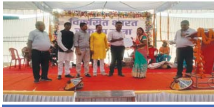
योजना का लाभ लेने वाईदासियों ने लिया आवेदन