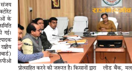
प्रोत्साहित करने की जरूरत है। किसानों द्वारा उत्पादित किए गए कृषि उत्पाद में कुछ विशेषता होनी चाहिए, जिससे उनके उत्पाद को मार्केट में अच्छा मूल्य मिल सके।