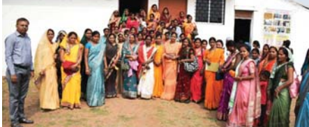
मशरूम, मुर्गीपालन, वर्मी खाद व बीज उत्पादन की दी गई जानकारी

राजनांदगांव (दावा)। कृषि विज्ञान केन्द्र राजनांदगांव प्रक्षेत्र में जिले की कृषि सखियों द्वारा भ्रमण किया गया। जिसमें प्रक्षेत्र की विभिन्न इकाईयां मशरूम, मुर्गीपालन, वर्मी खाद व बीज उत्पादन की विस्तृत जानकारी दी गई। कृषि सखियों को खेती में प्राकृतिक खेती में उपयोग होने वाले अवयव पोषक तत्व के लिए बीजामृत, घनजीवामृत, जीवामृत बनाने की विधि व उपयोग करने की विस्तृत जानकारी दी गई। जिसमें बीजामृत बनाने की विधि व बीजों के उपचार की प्रक्रिया को बताया गया। मृदा में पोषक तत्व की मात्रा को बढ़ाने के लिए बुआई से पूर्व घनजीवामृत बनाकर मृदा में उचित मात्रा में डालने की विधि को बताया गया। डब जीवामृत