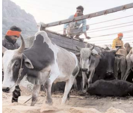
डोंगरगढ़ (दावा)। गौ तस्करी की बढ़ती घटना के बीच गुरुवार सेनने वाली गाड़ी भिलाई के गौ की सुबह 5:30 बजे 41 गौ माता को कड़ी पार ले जाने की घटना सामने आई। जिसमें गौ तस्करी करने वाली गाड़ी भिलाई के गौ कलकसा में पकड़ा गया।

गौ सेवकों ने पुलिस की मदद से सभी गौ माताओं को सुरक्षित गौशाला पहुंचाया