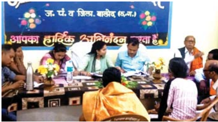
ग्राम सभा द्वारा अनुशासित निष्कर्षों के निराकरण हेतु निकासी बैठक जारी

बालोद (दावा)। छत्तीसगढ़ सामाजिक अंकेक्षण इकाई द्वारा बालोद जिले के सभी विकासखंड के कुल 120 ग्राम पंचायतों में वित्तीय वर्ष 2021-22 एवं 2022-23 में संपादित नगरीय कार्यों का सामाजिक अंकेक्षण उपरांत ग्राम सभा का आयोजन किया गया।