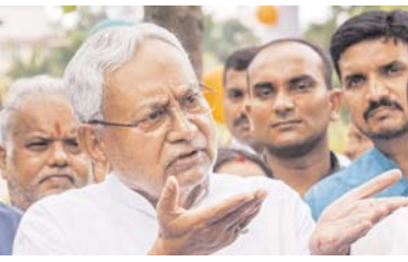
लोक स्वास्थ्य अभियंत्रण विभाग में पूर्व मंत्री के स्तर पर किए गए कार्यों एवं उनके द्वारा लिए गए निर्णयों की समीक्षा की जाएगी। आगे लिखा है कि यदि आवश्यक हो तो सक्षम प्राधिकार से अनुमोदन के उपरांत उनमें संशोधन किया जाए। इस संबंध में विभागीय मंत्री को संबंधित आदेशों की जानकारी देते हुए उक्त मंत्री से आवश्यक निर्देश प्राप्त किया जाए।

पटना। बिहार में 28 जनवरी 2024 को सुबह 11 बजे मुख्यमंत्री नीतीश कुमार ने इस्तीफा दिया और उसी शाम फिर नए सीएम के रूप में उन्होंने शपथ भी ली। पहले वह महागठबंधन सरकार के मुखिया थे और अब वह राष्ट्रीय जनतांत्रिक गठबंधन सरकार के सर्वेसर्वा हैं। नई सरकार के बहुमत हासिल करने के बाद अब फैसलों की घड़ी आ गई है। फैसले के तहत राज्य की नई सरकार ने पिछली सरकार के मंत्रियों के फैसलों की समीक्षा का निर्णय लिया है। इस फैसले के तहत राष्ट्रीय जनता दल कोटा के मंत्रियों के विभागों में लिए गए फैसलों की मुख्य रूप से समीक्षा की जाएगी। समीक्षा के बाद देखा जाएगा कि उनमें किसे रद्द करना है या किसे किस तरह से संशोधित कर काम चलाया जा सकता है।