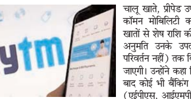
अपने खातों से शेष राशि की निकासी या उपयोग की अनुमति उनके उपलब्ध शेष राशि (कोई परिवर्तन नहीं) तक बिना किसी प्रतिबंध के दी जाएगी। 15 मार्च, 2024 (29 फरवरी, 2024 की पूर्व निर्धारित समयसीमा से विस्तारित) के बाद किसी भी ग्राहक खाते, प्रीपेड उपकरण, वॉलेट, फार्स्टेज, नेशनल कॉमन मोबाइलिटी कार्ड आदि सहित एईपीएस, आईएमपीएस और यूपीआई सहित एईएस फंड ट्रांसफर की अनुमति किसी भी समय दी जा सकती है। पेटाएम पेमेंट्स बैंक लिमिटेड द्वारा बनाए गए वन97 कम्युनिकेशंस लिमिटेड और पेटाएम पेमेंट्स सर्विसेज (शेष पृष्ठ 6 पर...)

नयी दिल्ली। भारतीय रिजर्व बैंक ने पेटाएम पेमेंट बैंक लिमिटेड (पीपीबीएल) के ग्राहकों के हित को ध्यान में रखते हुए उन्हें बैंकालयक व्यवस्था करने के लिए थोड़ा और समय देने के उद्देश्य से पीपीबीएल की सेवाओं को बंद करने की अवधि को 15 दिन बढ़ाकर 15 मार्च 2024 कर दी है। रिजर्व बैंक ने शुक्रवार को जारी एक बयान में कहा कि व्यापक सार्वजनिक हित को ध्यान में रखते हुए ये निर्णय लिए गए हैं। उन्होंने कहा कि 15 मार्च, 2024 (29 फरवरी, 2024 की पूर्व निर्धारित समयसीमा से विस्तारित) के बाद किसी भी ग्राहक खाते, प्रीपेड उपकरण, वॉलेट, फार्स्टेज, नेशनल कॉमन मोबाइलिटी कार्ड आदि में कोई और जमा या क्रेडिट लेनदेन या टॉप अप की अनुमति नहीं दी जाएगी। किसी भी ब्याज, कैशबैक, पार्टनर बैंकों से स्वीप इन या रिफंड के अलावा जो कभी भी जमा किया जा सकता है। इसके ग्राहकों द्वारा बचत बैंक खाते, चालू खाते, प्रीपेड उपकरण, फार्स्टेज, नेशनल कॉमन मोबाइलिटी कार्ड आदि सहित