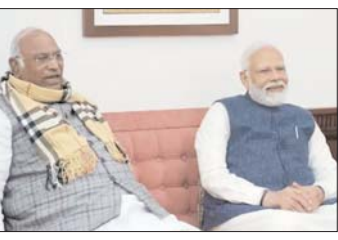
अध्यक्ष ने कहा कि पीएम मोदी कहते रहते हैं कि यह मोदी की गारंटी है। अशोक चव्हाण पर भी बरसे खरगे पूर्व मुख्यमंत्री अशोक चव्हाण के हाल ही में भाजपा में शामिल होने पर खरगे ने कहा कि इस तरह पाला बदलना कायरतापूर्ण है। उन्होंने कहा कि भाजपा द्वारा विपक्षी नेताओं को डराकर अपनी पार्टी में शामिल कराया जा रहा है। उन्होंने कहा कि संसद में एक चाय बैठक के दौरान मैंने प्रधानमंत्री मोदी से पूछा कि आप (भाजपा) कितने लोगों को अपने पाले में करने जा रहे हैं, क्योंकि मंत्री और पूर्व मुख्यमंत्री आपके पाले में आ रहे हैं।

खरगे ने पुणे में कांग्रेस द्वारा आयोजित एक कार्यक्रम में पार्टी कार्यकर्ताओं को संबोधित करते हुए कहा कि मैं उनसे पूछना चाहता हूँ कि 2014 के दौरान किए गए वादों का क्या हुआ? उन्होंने उन्हें कभी पूरा नहीं किया। ‘मोदी झूठों का सरदार’ हैं। उन्होंने कहा, पीएम मोदी झूठ बोलते रहते हैं, आप