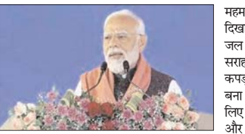
महम-हॉसी खंड पर ट्रेन सेवा को हरी झंडी दिखाई। प्रधानमंत्री ने कहा, हरियाणा सरकार ने जल संबंधी समस्याओं के समाधान के लिए सराहनीय कार्य किया है और राज्य हरियाणा कपड़ा तथा परिधान उद्योग में अपना बड़ा नाम बना रहा है। उन्होंने कहा, हरियाणा निवेश के लिए एक शीर्ष राज्य के रूप में उभर रहा है, और निवेश बढ़ने का मतलब है नई नौकरी के अवसरों में वृद्धि। प्रधानमंत्री ने सभा में बहुरंगों की भूमि रेवाड़ी को ब्रह्मजालि आर्पित की और उनके प्रति क्षेत्र के लोगों के स्नेह को रेखांकित किया। उन्होंने 2013 में प्रधानमंत्री पद के उम्मीदवार के तौर पर अपने पहले कार्यक्रम को याद किया और लोगों की शुभकामनाओं को याद किया। प्रधानमंत्री ने कहा कि जनता का आशीर्वाद उनके लिए बहुत बड़ी पूंजी है। उन्होंने भारत को दुनिया में नई ऊंचाइयों पर ले जाने का श्रेय लोगों के आशीर्वाद को दिया। संयुक्त अरब अमीरात और कतर की अपनी इसी सप्ताह की यात्रा के बारे में जिक्र करते हुए प्रधानमंत्री ने निवेशक मंच पर भारत को मिले सम्मान और सद्भावना के लिए देश (शेष पृष्ठ 6 पर...)

नयी दिल्ली/रेवाड़ी। प्रधानमंत्री नरेंद्र मोदी ने शुक्रवार को कहा कि पूरी दुनिया इस समय भारत में नए-नए अवसरों को देखते हुए देश में निवेश करना चाहती है और निवेश के लिए हरियाणा एक उत्तम राज्य बन कर उभरा है। श्री मोदी हरियाणा में रेवाड़ी में आज मैं एम्स और गुरुग्राम मेट्रो रेल परियोजना की आधारशिला रखने के साथ ही कई और परियोजनाओं के लोकार्पण और शिलान्यास के अवसर पर आयोजित एक जनसभा को संबोधित कर रहे थे। इन परियोजनाओं की लागत कुल मिला कर 9750 करोड़ रुपये से अधिक की है। श्री मोदी ने कहा, आज पूरा विश्व भारत में निवेश के लिए उत्सुक है और निवेश के लिए हरियाणा एक उत्तम राज्य बनकर उभर रहा है। कार्यक्रम के मंच पर मैं हरियाणा के राज्यपाल बंगारू दत्तात्रेय और मुख्यमंत्री मनोहर लाल खट्टर और कई अन्य गणनायक व्यक्ति उपस्थित थे। इससे पहले श्री मोदी ने इस कार्यक्रम के बारे में सोशल मीडिया प्लेटफॉर्म एक्स पर कहा था कि इन परियोजनाओं से हरियाणा का स्वास्थ्य, रेल और पर्यटन सेक्टर और समृद्ध होगा। प्रधानमंत्री ने कहा, हरियाणा