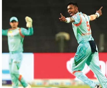
करोड़ रुपये में खरीदा था। चमीरा के आने से टीम के 50 लाख रुपये बच गए हैं। कोलकाता ने लखनऊ सुपर

नई दिल्ली। आईपीएल के आगामी सीजन से पहले कोलकाता नाइटराइडर्स (केकेआर) को को बड़ा झटका लगा है। उसके तेज गेंदबाज गस एटकिंसन टूर्नामेंट से बाहर हो गए हैं। इंग्लैंड के इस तेज गेंदबाज का दुनिया के सबसे बड़े टी20 लीग में खेलने का सपना टूट गया। एटकिंसन के स्पॉलर पर केकेआर ने श्रीलंका के तेज गेंदबाज दुष्मंथा चमीरा को टीम में शामिल किया है।