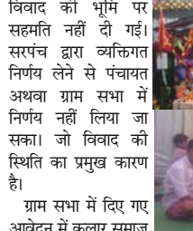
चलते विवाद के बीच श्रीराम, हनुमान व कलारि माता की मूर्तियों की स्थापना व प्राण प्रतिष्ठा ग्राम बेलगांव डडसेना कलारि समाज द्वारा इष्टदेवी माता बहादुर कलारि देवी के साथ श्रीराम, माता सीता व हनुमान की मूर्तियों स्थापना के साथ प्राण प्रतिष्ठा का विधिवत कार्यक्रम कर सामाजिक कार्यकर्ता दिन रात पूजा पाठ में लगे हुए हैं, ताकि प्रशासन द्वारा भविष्य में अतिक्रमण के खिलाफ की जाने वाली कार्रवाई का भरपूर विरोध किया जा सके।