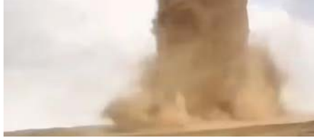
लोगों को रेस्क्यू कर उन्हें सुरक्षित जगह पहुंचाया। बीजिंग स्थित सीजीटीएन समाचार चैनल की एक रिपोर्ट के अनुसार, रेतीले तूफान ने शिनजियांग के तुपान में वहां की भूमिगत नहरों को खराब कर दिया, जबकि रेत के बवंडर के कारण विजिबिलिटी कम होने की वजह से कई यात्री भी सड़क पर फंसे हुए थे। रिपोर्ट में यह भी कहा गया है कि 17 फरवरी की सुबह हामी शहर धुंध से ढका हुआ था, जबकि आसमान रेत और धूल से ढका हुआ था। शिनजियांग के अलावा, इसकी राजधानी शीआन सहित शानक्सी प्रांत के शहर धूल से ढके हुए थे, जबकि गांसु प्रांत के जिउझान शहर में रेतीले तूफान के कारण नेशनल हाईवे बंद हो गए, जिससे यात्री सड़कों पर फंसे हैं। चीन के लोगों के लिए मुसीबतें कम होने का नाम नहीं ले रही है। एक तरफ जहां रेतीले तूफान ने कहर मचाया हुआ है।

नई दिल्ली। चीन पर प्रकृतिक आपदा की मार पड़ रही है। यहां पर रेतीले तूफान ने कहर मचाया है। चीन के शिनजियांग प्रांत में लोगों का घर से निकलना तक मुश्किल हो गया है। यहां कई इलाकों में तूफानी हवाओं ने ऐसा कहर बरपाया कि सबकुछ धुंधला हो गया। सड़क पर चल रही गाड़ियों भी नजर नहीं आ रही थी। रेतीले तूफान की प्रचंडता का अंदाजा इसी बात से लगाया जा सकता है कि इन हवाओं की चपेट में आने से कई पेड़ जड़ उखड़े गए। इस दौरान कुछ पेड़ों को हवा में उड़ते हुए भी देखा गया। पूरा आसमान नारंगी रंग का हो गया। रेतीले तूफान की वजह से हजारों लोग शिनजियांग प्रांत के अलग-अलग हिस्सों में फंस गए। जिसके बाद पुलिस ने