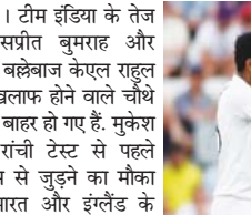
बल्ले से एक भी अर्धशतक नहीं निकला है। पांच टेस्ट मैच की सीरीज में रोहित शर्मा की टीम ने 2-1 की बढ़ बनाई हुई है। पहला मैच इंग्लैंड ने जीता, तो दूसरे में भारत ने जीत दर्ज की। राजकोट में खेले गए तीसरे टेस्ट मैच को भारत ने 434 रनों के बड़े अंतर से जीतकर 2-1 की बढ़त हासिल कर ली। अब रांची में टीम इंडिया मुकाबला जीतकर सीरीज को अपने नाम करना चाहेगी। वहीं इंग्लैंड के कप्तान बेन स्टोक्स हर हाल में सीरीज को बराबरी पर लाने की कोशिश करेंगे। ऐसे में उम्मीद की जा रही है कि चौथा टेस्ट काफी कांटे का होगा। चौथे टेस्ट के लिए भारतीय टीम- रोहित शर्मा (कप्तान), यशस्वी जयसवाल, शुभमन गिल, रजत पाटिदार, सरफराज खान, ध्रुव जुरेल (विकेटकीपर), केएस भरत (विकेटकीपर), देवदत्त पंडिकरल, अश्विन, रवींद्र जडेजा, अक्षर पटेल, वाशिंगटन सुंदर, कुलदीप यादव, मोहम्मद सिराज, मुकेश कुमार, आकाश दीप

नई दिल्ली। टीम इंडिया के तेज गेंदबाज जसप्रीत बुमराह और विकेटकीपर बल्लेबाज केएल राहुल इंग्लैंड के खिलाफ होने वाले चौथे टेस्ट मैच से बाहर हो गए हैं। मुकेश कुमार को रांची टेस्ट से पहले भारतीय टीम से जुड़ने का मौका मिला है। भारत और इंग्लैंड के बीच चौथा टेस्ट मैच 23 फरवरी से रांची में खेला जाएगा। पांच मैचों की टेस्ट सीरीज में भारतीय टीम 2-1 से बढ़त बनाए हुए है। बीसीसीआई ने कहा कि लंबी सीरीज को देखते हुए बुमराह को रिलीज किया गया है, वहीं केएल राहुल को फिटनेस के चलते चौथे टेस्ट मैच से बाहर होना पड़ा है। राहुल तीसरा टेस्ट मैच भी नहीं खेल पाए थे। इतना ही नहीं धर्मशाला में होने वाले आखिरी और 5वें टेस्ट मैच में वह खेलेंगे या नहीं ये उनकी फिटनेस पर निर्भर होगा। वहीं तेज गेंदबाज मनोज कुमार की टीम में वापसी हुई है, उन्हें तीसरे टेस्ट मैच से पहले रिलीज कर दिया गया था। तीसरे टेस्ट से पहले केएल राहुल की स्थान पर देवदत्त पंडिकरल को टीम के साथ जोड़ा गया था। पंडिकरल टीम के साथ जुड़े रहेंगे और चौथे टेस्ट में उन्हें डेब्यू का मौका भी मिल सकता है। इसके अलावा रजत पाटिदार को चौथे टेस्ट की प्लेइंग 11 से बाहर किया जा सकता है। दो टेस्ट में रजत पाटिदार कोई कमाल नहीं दिखा पाए और चार पारियों में उनके