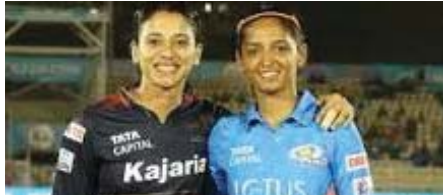
मार्च तक बंगलुरु के मुकाबले होंगे। इसके बाद दिल्ली इस लीग की मेजबानी करेगा। वुमेंस प्रीमियर लीग के सभी मुकाबले भारतीय समयानुसार शाम 7:30 पर शुरू होंगे। इन मैचों का सीधा प्रसारण स्पोर्ट्स 18 नेटवर्क पर होगा। वहीं, इन मैचों में लाइव स्ट्रीमिंग जियो सिनेमा एप पर फ्री में दिखाई जाएगा। वुमेंस प्रीमियर लीग की शुरुआत साल 2023 में हुई थी। आईपीएल के तर्ज पर शुरू हुई ये लीग दुनिया की पहली लीग है जिसमें महिला खिलाड़ियों का ऑक्शन हुआ था। वुमेंस प्रीमियर लीग की सबसे बड़ी खासियत यह रही थी कि इस लीग के पहले ही सीजन में दुनियाभर की कई बड़ी खिलाड़ी शामिल हुईं। मुंबई इंडियंस की टीम महिला आईपीएल के पहले सीजन का खिताब जीतने में कामयाब रही थी।

नई दिल्ली। वुमेंस प्रीमियर लीग के दूसरे सीजन की शुरुआत 23 फरवरी से बंगलुरु में होने जा रही है। वुमेंस प्रीमियर लीग 2024 में पांच टीमों के बीच कुल 22 मैच खेले जाएंगे। लीग के मैच दो लेग में खेले जाएंगे। पहला लेग बंगलुरु और दूसरा लेग दिल्ली में होगा। टूर्नामेंट का पहला मुकाबला मुंबई इंडियंस और दिल्ली कैपिटल्स महिला टीमों के बीच खेला जाएगा। वहीं इस बार मुकाबलों का आयोजन बंगलुरु और दिल्ली में किया जाएगा। इस लीग का पहला सीजन मुंबई की टीम ने अपने नाम किया था। डब्ल्यूपीएल के मुकाबले अरुण जेटली स्टेडियम और चित्रास्वामी स्टेडियम में खेले जाएंगे। इसमें 23 फरवरी से 4