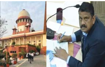
फैसले पर बोले अरविंद केजरीवाल, लोकतंत्र बचाने के लिए शुक्रिया सुको