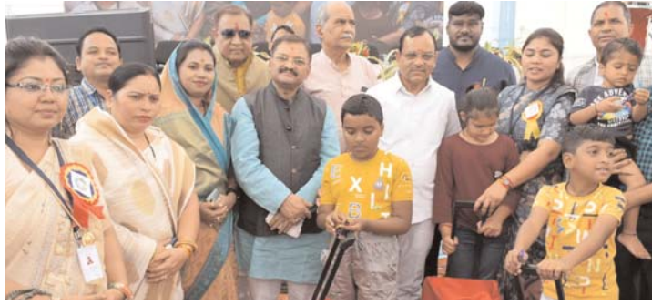
चेयर सहित अन्य उपकरण प्रदान किया गया। सांसद श्री पाण्डेय ने कार्यक्रम में उपस्थित सभी लोगों को शुभकामनाएं एवं शुभेच्छा दी।

जहाँ दिव्यांगजनों के लिए सभी प्रकार के यंत्र, प्रशिक्षण, पालकों को प्रशिक्षण और सभी प्रकार की व्यवस्था इस अत्याधुनिक भवन में व्यवस्थित रूप से की जाएगी। उन्होंने कहा कि विधानसभा अध्यक्ष डॉ. रमन सिंह का इस भवन निर्माण के लिए लगातार प्रयास रहा है। आज राजनांदगांव जिले को नये भवन की सीमा मिली है। जिसमें केवल राजनांदगांव ही नहीं पूरे छत्तीसगढ़ राज्य के लोगों को यहां लाभ प्राप्त होगा। यहां दिव्यांगजनों को सभी प्रकार का प्रशिक्षण प्राप्त होगा। उन्होंने प्रधानमंत्री नरेंद्र मोदी ने भारत को विकसित भारत बनाने के लिए तथा विश्व में अग्रणी देश बनाने के लिए जो संकल्प लिया है। हम सब उसमें सहभागी और सहयोगी बनेंगे। उन्होंने कहा कि सबका साथ, सबका विश्वास, सबका विकास, सबका प्रयास हम सब भागीदारी बनेंगे। उन्होंने सामाजिक न्याय और अधिकारिता मंत्री भारत सरकार डॉ. वीरेन्द्र कुमार को नये भवन के लिए आभार व्यक्त किया। इस दौरान सांसद संतोष पाण्डेय ने हिराग्रहियों को सहायक उपकरण हिरियर एड, टीएलएम क्रिट, गतिशीलता उपकरण, व्हील