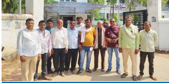
कहा- देश के विकास में भरपूर सहयोग लेकिन निजी जमीन नहीं देंगे

रवैरागढ़ (दावा)। केसीजी जिले के घुईखदान ब्लॉक के ग्राम विचारपुर, भरदागोड़, बुंदेली, पंडरिया, संडी में उच्च कालिटी के सीमेंट बनाने में उपयोग होने वाला हाईग्रेड चूना पत्थर का अकूत भंडार हैं। सत्ता परिवर्तन के बाद राज्य की विष्णुदेव साठ सरकार ने क्षेत्र में सीमेंट का मेगा प्लांट लगाने निविदा भी जारी किया है। राज्य सरकार द्वारा निविदा जारी होने के बाद देश की आधा दर्जन नामचीन कंपनियों ने सीमेंट प्लांट लगाने निविदा में भाग लिया है। जिसमें श्री सीमेंट कंपनी को राज्य सरकार ने (एलओआई) प्लांट लगाने स्वीकृति भी दे दी है। राज्य सरकार के द्वारा प्लांट लगाने सैद्धांतिक निर्णय लेने के बाद पर्यावरण मंजूरी व जनसुनवाई के लिये अब प्रशासनिक स्तर पर तैयारी की जा रही है। लेकिन विचारपुर के ग्रामीणों ने बुधवार को कलेक्टर कार्यालय पहुंचकर सीमेंट फैक्ट्री नहीं खोलने का विरोध करते हुए कलेक्टर को ज्ञापन दिया है।