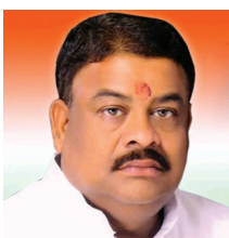
7 दिवस में निराकरण नहीं होने पर आंदोलन की चेतावनी

राजनांदगांव/ डोंगरगांव (दावा)। गर्मी बढ़ने के साथ ही विद्युत खपत में बढोत्तरी होने से क्षेत्र में लो वोल्टेज की समस्या बढ़ गई है जिससे आमलोग तो परेशान हो ही रहे है इसके साथ किसानों को लो वोल्टेज की समस्या से भारी समस्याओं का सामना करना पड़ रहा है। लो वोल्टेज की वजह से सिंचाई मोटर पंप चलने लगे है जिससे किसानों को आर्थिक नुकसान उठाना पड़ रहा तथा फसल नष्ट होने की स्थिति में है।