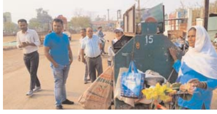
राजस्व करों का भुगतान करने करदाताओं से किये अपील

राजनांदगांव (दावा)। निगम आयुक्त अभिषेक गुप्ता प्रतिदिन प्रातः साफ सफाई एवं निर्माण कार्यों का वाईट में निरीक्षण कर निर्माण कार्यों में गति लाते तथा सफाई व्यवस्था में सुधार लाने निर्देशित कर रहे हैं। निरीक्षण की कडी में उनके द्वारा आज वाईट नं. 12 स्टेशन पारा वाईट तथा वाईट नं. 13 गौरी नगर में सफाई एवं निर्माण का जायजा लेकर करदाताओं से अपने लक्षित राजस्व करों का भुगतान करने अपील किये।