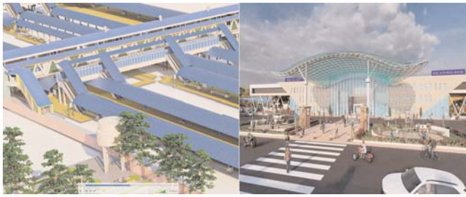
यात्री केन्द्रित सुविधाओं का किया जाएगा उन्नयन एवं आधुनिकीकरण

बिलासपुर (दावा)। रेल मंत्रालय के महत्वाकांक्षी परियोजना के अंतर्गत यात्रियों को विश्वस्तरीय सुविधा प्रदान करने हेतु 'अमृत भारत स्टेशन' योजना के अंतर्गत स्टेशनों के कार्यालय की तैयारी की जा रही है। इस कड़ी में दक्षिण पूर्व मध्य रेलवे की 49 स्टेशनों एवं छत्तीसगढ़ राज्य के अंतर्गत 32 स्टेशनों का पूर्णविकास अमृत भारत स्टेशन योजना के अंतर्गत किया जा रहा है। अभी हाल ही में 26 फरवरी 2024 को प्रधानमंत्री जी के द्वारा अमृत भारत स्टेशन योजना के द्वितीय चरण में देश के 553 रेलवे स्टेशनों के साथ दक्षिण पूर्व मध्य रेलवे की 37 स्टेशनों एवं छत्तीसगढ़ राज्य के अंतर्गत 21 स्टेशनों के पुनर्विकास के कार्य का शिलान्यास किया गया। भिलाई पावर हाउस रेलवे स्टेशन को आने वाले 40-50 सालों के यात्रियों की संख्या को ध्यान में रख कर इस वृहत कार्य की योजना बनाई गई है। भिलाई पावर हाउस रेलवे स्टेशन को विकसित करने का लक्ष्य रेल यात्रियों को विश्वस्तरीय सुविधाएं और बेहतर यात्रा अनुभव प्रदान करना है। रेलवे स्टेशन के आसपास अच्छी व्यवस्थाएं होने से आर्थिक गतिविधियों को भी बढ़ावा मिलेगा। रेलवे देश की लाइफ लाइन है। रेलवे लगातार यात्री सेवा को सुलभ करने के लिए नवीनतम