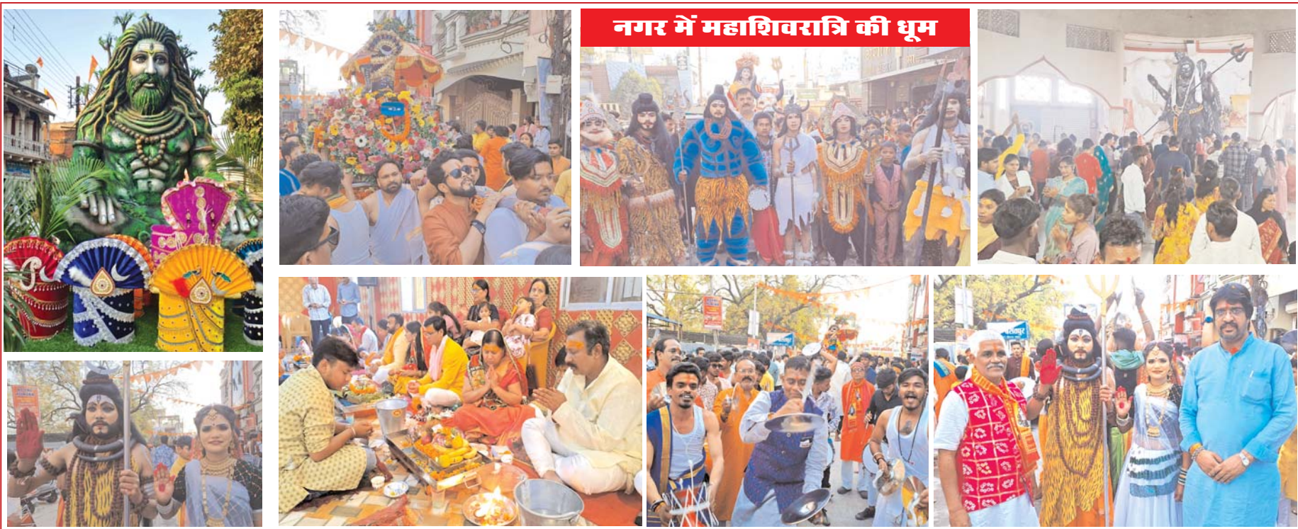
नगर में महाशिवरात्रि की धूम