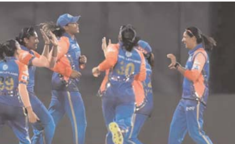
टीम 118 रन ही बना सकी। साइका इशाक 3 विकेट मुंबई की बॉलर साइका इशाक को 3 विकेट मिले। वहीं, नेटली सीवर ब्रंट ने 2 विकेट हासिल किए। शबनिम इस्माइल, हेली मैथ्यूज, पूजा वसन्तकर और सजीवन संजना को 1-1 विकेट मिला। पॉइंट्स टेबल में दूसरे नंबर पर आया मुंबई मुंबई इंडियंस पॉइंट्स टेबल में तीसरे से दूसरे नंबर पर आ गई है। दिल्ली के साथ ही उसके सबसे ज्यादा 8 पॉइंट हैं। यूपी चौथे नंबर पर ही बना हुआ है।

नई दिल्ली। दिल्ली के अरुण जेटली स्टेडियम में मुंबई ने टॉस जीतकर बल्लेबाजी चुनी। टीम ने 20 ओवर में 6 विकेट खोकर 160 रन बनाए। जवाब में यूपी 20 ओवर में 9 विकेट खोकर 118 रन ही बना सकी। मुंबई की नेटली सीवर ब्रंट ने दोहरा प्रदर्शन किया। ब्रंट ने बल्लेबाजी करते हुए 45 रन बनाए। वहीं, गेंद से 2 विकेट लिए। मुंबई की ओपनिंग जोड़ी नहीं चली। यासिका भाटिया 9 रन और हेली मैथ्यूज 4 रन बना कर आउट हो गए। स्कोर 3.4 ओवर में 2 विकेट पर 17 रन हो गया। मिडिल ऑर्डर पर आए नेटली सीवर ब्रंट 45 रन और मसमनप्रीत कौर 33 रन बना कर टीम को मजबूत स्कोर पर पहुंचाया। दोनों के बीच 59 रन की साझेदारी हुई। नेटली सीवर को आउट होने के बाद अर्मेनिया के 39 रन की पारी खेली। अमनजोत कौर 7 रन बना सकी। जबकि, आखिरी ओवर्स में 14 बॉल में 22 रन बना कर 160 रन के स्कोर तक पहुंचाया। श्रीलंका की प्लेयर और यूपी की बॉलर चमारी अटापट्टू को 2 विकेट मिली। उन्होंने शुरुआती ओवर में मैथ्यूज और भाटिया को चलता किया। उनके अलावा राजेश्वर गायकवाड, दीप्ति शर्मा और साइमा ठाकुर पर 1-1 विकेट मिले। यूपी की ओपनिंग बल्लेबाज एलिसा हिली 3 रन और किरण नवगिरी 7 रन बना कर आउट हुईं। वहीं, चमारी अटापट्टू भी 3 रन बना कर आउट हो गईं। ग्रेस हैरिस 15 रन ही बना सकी। वहीं, श्वेता सेहरावत 17 रन बना कर आउट हो गईं। दूसरे छोर पर दीप्ति शर्मा टिकी रही। पूनम खेमनर 7 रन, सोफी एक्लेस्टोन 0 रन, उमा छेत्री 8 रन बना कर आउट हो गए और विकेट गिरते ही चले गए। दीप्ति शर्मा ने ही एक छोर से पारी को बढ़ाया और 36 बॉल में 53 रन बना कर नाबाद रही। वहीं, राजेश्वरी गायकवाड 1 रन बना कर उनके साथ क्रीज पर