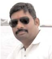
कहा - राजनांदगांव सहित पूरे छत्तीसगढ़ की सभी 11 सीट जीतेगी भाजपा