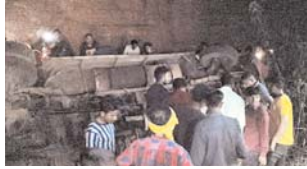
खदान में 50 फीट नीचे गिरी है।

भिलाई (दावा)। दुर्ग जिले में केडिया डिस्ट्रिक्ट के 40 कर्मचारियों को लेकर कुम्हारी से भिलाई लौट रही बस मंगलवार रात नौ बजे खदान में गिर गई। इस हादसे में 11 लोगों की मौत हो गई है। एसडीआरएफ और पुलिस की टीम ने घटनास्थल पर पहुंचकर बचाव कार्य शुरू कर दिया है। पुलिस के अनुसार बस लौटने के दौरान एक मुरुम