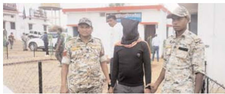
अम्बागढ़ चौकी (दावा)।