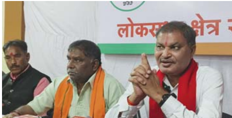
नक्सलियों से मिलकर षड़यंत्र