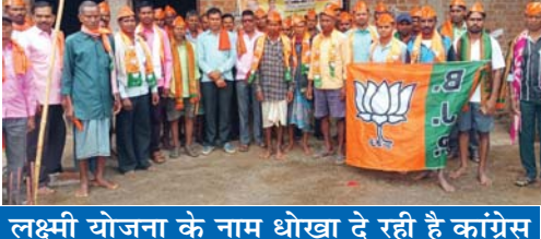
लक्ष्मी योजना के नाम धोखा दे रही है कांग्रेस