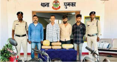
गिरफ्तार आरोपी गांजा को ओड़िसा से खरीदकर छत्तीसगढ़ में करते थे तस्करी

राजनांदगांव (दावा)। घुमका पुलिस ने गांजा तस्करी की दूसरी बड़ी कार्यवाही की है जिसके तहत आरोपियों के कब्जे से 6 किलोग्राम अवैध मादक पदार्थ गांजा कीमत 90 हजार रुपये एवं परिवहन में प्रयुक्त 03 मोटर साइकिल एवं 02 नग एंड्रइड मोबाइल फोन व 2 नग कोपेड मोबाइल कीमती 2 जप्त किया गया है।