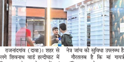
राजनांदगांव (दावा)। शहर से लगे शिवनाथ वार्ड हल्दीघाट में स्थित आइकेयर शोरूम में मां गायत्री ऑप्टिकल अपने नए साज सज्जा के साथ संचालित किया जा रहा है, शोरूम में निःशुल्क नेत्र जांच की सुविधा के साथ आपको अपनी पर्यनालिट्टी के अनुसार आईवीयर चुनने की सुविधा देता है यहाँ पर किरायेवाली दामों पर सर्वोत्तम लेंस चश्मा की खरीदारी की जा सकती है, मां गायत्री ऑप्टिकल की कोई शाखा नहीं है, अतः उपभोक्ता शिवनाथ वार्ड 51 हल्दीघाट राजनांदगांव स्थित संस्थान में आकर उपरोक्त ऑफर का लाभ उठा सकते हैं।