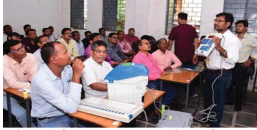
प्रभारी, स्टू चार्ट, सेक्टर ऑफिसर एवं अन्य महत्वपूर्ण जानकारी एवं सूचनाओं की समय पर पहुंच सुनिश्चित करने की दिशा में यह अद्वितीय नवाचार प्रभावी है। पहले से सूचना मिल जाने के कारण मतदान दलों के लिए यह सुविधाजनक एवं आसान रहेगा। इतनी बड़ी संख्या में प्रशिक्षणार्थियों को एसएमएस के माध्यम से अलग-अलग तरह की सूचनाएं प्रदान करना चुनौतीपूर्ण कार्य रहा है। जिला पंचायत सीईओ एवं प्रभारी अधिकारी