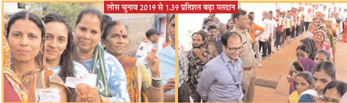
लोकसभा चुनाव 2019 से 1.39 प्रतिशत बढ़ा मतदान

प्राप्त जानकारी अनुसार संसदीय निर्वाचन क्षेत्र क्रमांक 6-राजनांदगांव अंतर्गत आने वाले 8 विधानसभा क्षेत्रों में कुल 77.42 प्रतिशत मतदान हुआ। जिसमें 78.44 प्रतिशत पुरुष मतदाता, 76.41 प्रतिशत महिला मतदाता एवं 62.50 प्रतिशत अन्य मतदाता ने मतदान किया। कुल 14 लाख 46 हजार 247 मतदाताओं ने अपने मताधिकार का प्रयोग किया। जिसमें 7 लाख 29 हजार 271 पुरुष मतदाता, 7 लाख 16 हजार 971 महिला मतदाता एवं 5 अन्य मतदाता शामिल हैं। विधानसभा क्षेत्र क्रमांक 71-पंडरिया में 71.97 प्रतिशत मतदान हुआ। जिसमें 74.38 प्रतिशत पुरुष मतदाता एवं 69.57 प्रतिशत महिला मतदाता ने मतदान किया। कुल 2 लाख 29 हजार 397 मतदाताओं ने अपने मताधिकार का