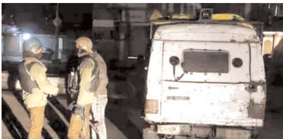
पूर्व सरपंच को उतारा मौत के घाट

घायल दंपति को उपचार के लिए जीएमसी अस्पताल अनंतनाग में भर्ती कराया गया है। इन हमलों में लिप्त आतंकीयों को पकड़ने के लिए सुरक्षाबलों ने तलाशी अभियान चलाया है। इन हमलों ने वादी में चुनाव के मद्देनजर किए गए सुरक्षा प्रबंधों को भी थोड़ा खोल दी है। अनंतनाग संसदीय निर्वाचन क्षेत्र के लिए पहले मतदान 25 मई को होना है। इसके अलावा यत्र पहलगाम में जहां पर्यटकों पर हमला हुआ है, वहां श्री अमरनाथ की तीर्थयात्रा के दौरान श्रद्धालुओं की काफी भीड़ रहती है। हालांकि पुलिस