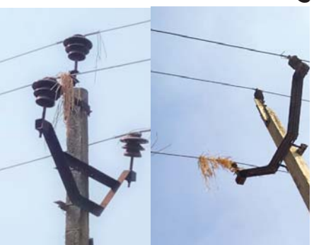
ग्रामीण इलाकों में रबी फसल धान एवं मक्का मिसाई के कारण विद्युत लाइनों में ब्रेकडाउन की मिल रही है शिकायतें

राजनांदगांव (दावा)। एसीसगढ़ स्टेट पावर डिस्ट्रीब्यूशन कंपनी द्वारा भीष्ण गर्मी में विद्युत लाइनों में आ रही व्यवधान को दृष्टिगत रखते हुये समस्त कृषक उपभोक्ताओं से विद्युत लाइनों के निकट रबी फसल जैसे धान, मक्का की मिसाई के कार्य को नही करने की अपील की गई है। उल्लेखनीय है कि किसानों के द्वारा गर्मी के फसल धान, मक्का की कटाई कर मिसाई के कार्य को कराया जा रहा है।