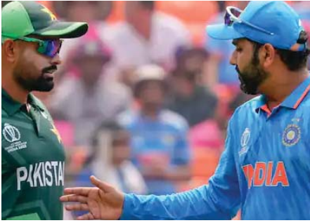
ललित मोदी का आईसीसी पर फूटा गुस्सा

नई दिल्ली। भारत और पाकिस्तान के बीच 9 जून को न्यूयॉर्क में मैच खेला जाएगा। टी20 विश्व कप 2024 के इस मुकाबले का फैसला को बेसब्री से इंतजार है। इस मुकाबले के टिकट मिलना काफी मुश्किल होंगे। दावा किया जा रहा है कि भारत-पाकिस्तान मैच का एक टिकट करीब 16 लाख रुपए में बिक रहा है। आईपीएल के पूर्व आयुक्त ललित मोदी ने इसको लेकर सोशल मीडिया पर एक पोस्ट शेयर की है।