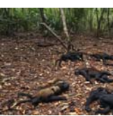
गर्मी का कहर, छह दिनों में 138 बंदरों की मौत

नई दिल्ली। दुनियाभर में लोग गर्मी का प्रकोप झेल रहे हैं। भारत के साथ-साथ विदेशों में भी तापमान 45 डिग्री सेल्सियस के ऊपर बना हुआ है। मेक्सिको में हालात और खराब हैं, यहां गर्मी के कारण जानवरों की मौत हो रही है। पिछले 6 दिनों में ही यहां अधिक गर्मी के कारण 138 बंदरों की मौत हो चुकी है। मेक्सिको में इन दिनों दिन का तापमान 46 डिग्री सेल्सियस तक है। गर्मी में इन बंदरों को बचाने के लिए स्थानीय लोग भी एकजुट हो रहे हैं। मरने वाले बंदरों की प्रजाति हाउजर है, इन बंदरों को उनकी दहाड़ेन वाली आवाजों के लिए जाना जाता है। ये बंदर मेक्सिको में खाड़ी तट के राज्य टबेस्को में मृत मिले। स्थानीय प्रशासन के अनुसार, 5 बंदरों को एक पशु हॉस्पिटल ले जाया गया, उन्हें फिर से जिंदा करने की कोशिश की गई, लेकिन वह सफल नहीं हो पाए। डॉ. सर्जियो ने कहा कि ये बंदर डिहाइड्रेटेशन और बुखार के कारण गंभीर स्थिति में पहुंचे। उन्हें लू भी लग गई थी। मेक्सिको में मार्च के बाद से अब तक गर्मी के कारण 26 लोगों की मौत हो चुकी है। पशु चिकित्सकों का कहना है कि गर्मी से सैकड़ों प्राइमेट मारे गए हैं।