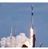
स्पेसएक्स ने नए अमेरिकी जासूस समूह के लिए लॉन्च किए उपग्रह