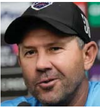
रिकी पोंटिंग ने कहा कि उन्हें भारतीय टीम का हेड कोच बनने में दिलचस्पी तो थी, लेकिन उनके इनकार करने की अपनी वजह है।

आईपीएल में किसी भी टीम को कोच नहीं कर पाएंगे। पोंटिंग ने आईसीसी को बताया- मैंने इस बारे में कई रिपोर्ट्स देखी हैं। आमतौर पर ये चीजें सोशल मीडिया पर सामने आ जाती हैं, इससे पहले कि आपको पता चले। लेकिन आईपीएल के दौरान कुछ लोग मुझसे मिले थे, यह जानने के लिए कि क्या मैं इसमें दिलचस्पी रखता हूँ। उन्होंने आगे कहा, मुझे किसी बड़ी राष्ट्रीय टीम का हेड कोच बनना अच्छा लगेगा, लेकिन मेरी जिंदगी में दूसरी चीजें भी हैं और मैं घर पर भी बिक बिताना चाहता हूँ। साथ ही, यह सब जानते हैं कि भारतीय टीम के कोच के रूप में आप किसी आईपीएल टीम से नहीं जुड़ सकते। पोंटिंग को पसंद है टूर्नामेंट में कोचिंग करना और वो अपने परिवार के साथ भी समय बिताना चाहते हैं। उनके बच्चे भी भारत में रहना पसंद करते हैं।