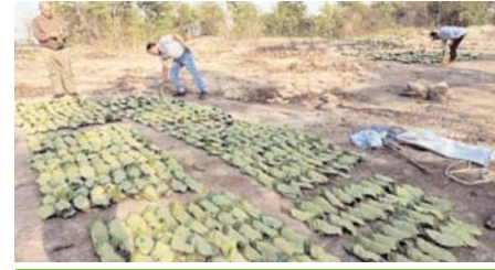
मानपुर वन क्षेत्र में छिट-पुट तोड़ाई का कार्य जारी

राजनांदगांव (दावा)। कवर्धा, खैरागढ़ सहित जिले के वन क्षेत्र में इस साल भी बड़े पैमाने पर तेन्दूपत्ता तोड़ाई का कार्य कराया जा रहा है। इस क्रम में राजनांदगांव जिले सहित कवर्धा जिले के वन क्षेत्र में तेन्दूपत्ता तोड़ाई का कार्य लगभग पूरा कर लिया गया है। कवर्धा जिले में जहां लक्ष्य से ज्यादा तेन्दूपत्ता की तोड़ाई कार्य हुआ है। वहीं राजनांदगांव जिले में 80 हजार 800 मानक बोरा लक्ष्य के बरअक्स 70 हजार मानक बोरा तेन्दूपत्ता का संग्रहण किया गया है। बताया जाता है कि अभी मानपुर वन क्षेत्र में छिटपुट रूप से तेन्दूपत्ता तोड़ाई का कार्य जारी है। इस क्षेत्र में देर से तोड़ाई कार्य शुरू होने के कारण तेन्दूपत्ता तोड़ाई कार्य में विलम्ब हो रहा है। बता दें कि वन विभाग द्वारा 25 जून तक तेन्दूपत्ता तोड़ाई का कार्य जारी रहने की बात कही गई थी। सो. 70 हजार मानक बोरा तुड़ाई के बाद अधिकांश जगह काम समेट लिया गया है। बता दें कि गत दिनों कवर्धा जिले के कुकुदुर वन समिति के तेन्दूपत्ता तोड़ने वाले श्रमिक वाहन दुर्घटना के शिकार हुए थे। जिसमें श्रमिकों की मौत हो गई थी। इस क्षेत्र के 10 समितियों में लक्ष्य से ज्यादा 135 प्रतिशत