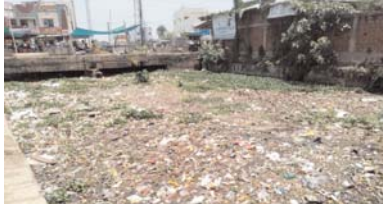
बहरहाल निगम द्वारा बारिश के पूर्व गंदगी से भरे बड़े नाले-नालियों की सफाई का कार्य केवल कहने-बताने के लिए ही ठीक लग रहा है। वस्तुस्थिति से साम्य नहीं बैठ रहा।

राजनांदगांव (दावा)। बारिश के पूर्व नगर निगम द्वारा शहर के बड़े नाले-नालियों की सफाई पोल इन द्रुश्यों से खुलती नजर आ रही है। दैनिक दावा ने 28 मई के अंक में 'बारिश सिर पर बारिश... कचरा -गंदगी से बजबजा रहा नाला' शीर्षक से नई चौक के समीप के मुकड़ के पास बजबजाते नाला व सुनार पारा क्षेत्र के गंदगी से भरे नाले का सचित्र प्रकाशन किया था। जबकि निगम के अफसरों द्वारा कहा जा रहा है कि बारिश के पूर्व शहर के सभी बड़े-नाले नालियों की सफाई का कार्य फरवरी माह से चालू कर दिया गया है। आयुक्त के निर्देश पर स्वास्थ्य का अमला प्रतिदिन नाला-सफाई मैन्युवेल व जेसीबी के माध्यम से कर रहे हैं। इसके साथ ही कार्यों का निरीक्षण किया जा रहा है। तो क्या यह सभी कार्य केवल कागजों में हो रहा है? यदि शहर के बड़े नाले-नालियों की सफाई की गई होती तो कचरे गंदगी से भरे ये बजबजाते हुए नाले-नालियों का चित्र इस तरह बर्बाद नहीं करते।