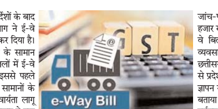
रही छूट के संबंध में 24 मई को अधिसूचना जारी कर दी है।

रायपुर। छत्तीसगढ़ सरकार के निर्देशों के बाद वाणिज्यिक कर (जीएसटी) विभाग ने ई-वे बिल पर दी जा रही छूट को खत्म कर दिया है। अब 50 हजार या इससे अधिक के सामान परिवहन पर एक जिले से दूसरे जिलों में ई-वे बिल की अनिवार्यता लागू होगी। इससे पहले कांग्रेस सरकार ने राज्य के भीतर सामानों के परिवहन पर ई-वे बिल की अनिवार्यता लागू नहीं की थी। ई-वे बिल को केंद्र सरकार ने एक अप्रैल 2018 को लागू किया है। वाणिज्यिक कर विभाग के अधिकारियों का कहना है कि जिलों के भीतर भी ई-वे बिल लागू होने से टैक्स चोरी रुकेगी वहीं, सरकार के राजस्व में भी वृद्धि होगी। देश के कई राज्यों में यह व्यवस्था पहले से लागू थी, लेकिन पूर्ववर्ती सरकार ने इसे लागू नहीं किया था। मध्य प्रदेश में 2022 से ही जिलों के भीतर जांच की व्यवस्था लागू हो चुकी है। वाणिज्यिक कर विभाग ने व्यापारियों को दी जा