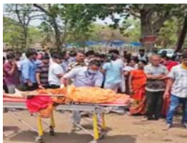
भिलाई में बाइक से बेटे के साथ गई थी राशन लेने, लौटते वक्त हादसे का शिकार

भिलाई (दावा)। छत्तीसगढ़ के भिलाई इस्पात संयंत्र के बोरिया गेट में एक तेज रफ्तार ट्रेलर ने बाइक सवार मां बेटे को टकरा मार दी। टकरा इतनी तेज थी कि मां बाइक से गिरकर हड़बवा के पहिए के नीचे आ गई, जिससे उसकी मौके पर मौत हो गई। सूचना मिलते सीआईएसएफ के अधिकारी और जवान वहां पहुंचे।