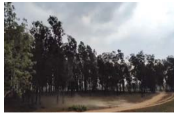
कई जिलों में लू के भी आसार

रायपुर (दावा)। छत्तीसगढ़ के लोगों के लिए सुकूनभरी खबर है। मौसम विभाग का कहना है कि प्रदेश में पारा तीन डिग्री सेल्सियस गिर सकता है। इसके साथ-साथ प्रदेश के कई शहरों में बारिश भी हो सकती है। आने वाले दिनों में पांच दिनों तक बस्तर संभाग के जिलों में आंधी-तूफान चलने के संभावना है। यहां बिजली भी गिर सकती है। हालांकि, 2 जून को प्रदेश के कई जिलों में लू चलने की चेतावनी जारी की गई थी।