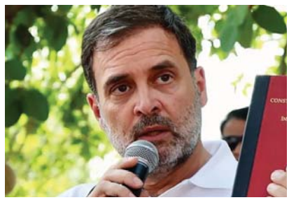
राहुल गांधी के समक्ष चुनौतियों की कमी नहीं रही। यहां तक कि कांग्रेस के अस्तित्व पर भी सवाल उठे।

एक कांग्रेस नेता के मुताबिक, चुनाव में बुरे प्रदर्शन के बावजूद वे राहुल गांधी ही थे जो अपने विश्वास पर दृढ़ रहे क्योंकि उन्हें उस पर विश्वास था कि लोकतंत्र में सबसे पहले आम लोग आते हैं