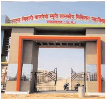
स्वास्थ्य सचिव की रायपुर में मेडिकल कॉलेज के अफसर सीएमएचओ सुपरिटेण्डेन आदि की बैठक हुई थी। इस दौरान स्वास्थ्य सचिव द्वारा इन दोनों

क्रिटिकल केयर यूनिट बता दे कि मेडिकल कॉलेज हास्पिटल के ठीक सामने पार्किंग वाले स्थल पर उक्त क्रिटिकल केयर यूनिट का निर्माण हो रहा है। जिसके फर्स्ट फ्लोर का बेस तैयार किया जा चुका है। बताया जाता है कि कोरोना महामारी के समय मेडिकल कॉलेज हास्पिटल में आने वाले गंभीर मरीजों की विशेष चिकित्सा के लिए क्रिटिकल केयर यूनिट बनाए जाने का प्रस्ताव हुआ था। वह अब जाकर निर्माण कार्य के रूप में सामने आ रहा है। मिली जानकारी के अनुसार उक्त यूनिट के संचालन के लिए जो विशेष अत्याधुनिक मशीनें व विशेषज्ञ डॉक्टरों की आवश्यकता होगी। उसकी व्यवस्था कैसी होगी इसके लिए आज मंगलवार 11 जून को बैठक रखी गई है। जानने में आ रहा है कि सीसीयू के लिए विशेषज्ञ डॉक्टर महाराष्ट्र से लाए जाएंगे। बहरहाल मेडिकल कॉलेज हास्पिटल में गंभीर मरीजों को स्पेशल चिकित्सा सुविधा उपलब्ध कराने के लिए हास्पिटल परिसर ने ही क्रिटिकल केयर यूनिट की व्यवस्था किए जाने हेतु कंट्रक्शन का कार्य शुरू हो गया। डॉक्टरों से लेकर स्टाफ नर्सों व अन्य चिकित्सीय सुविधा का अभाव झेल रहे मेडिकल कॉलेज हास्पिटल में क्रिटिकल केयर यूनिट का निर्माण किए जाने पर लोगों का उमालिया उठने लगी है।