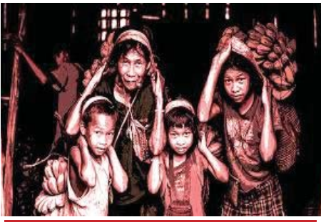
विश्व बाल श्रम निषेध दिवस

मालूम हो कि इसको मनाने के पीछे एक खास वजह यह थी कि बच्चों को मजदूरी न कराकर उनको स्कूलों की ओर शिक्षा के लिए प्रेरित किया जा सके। मालूम हो कि बाल श्रम लगातार एक गंभीर समस्या बनता जा रहा है, जिसके कारण बच्चों का बचपन गर्त में जा रहा है और उनको अपना अधिकार नहीं मिल पा रहा है। उनका यह बचपन रूपी भविष्य आज बाल श्रम के कारण नशे, अपराध एवं जटिलताओं की दुनिया में धंसा चला जा रहा है। जब हम किसी गली, चौराहे, बाजार, सड़क और हाईवे से गुजरते हैं और किसी दुकान, कारखाने, रैपटरीय या ढाबे पर 12-14 साल के बच्चे को टायर में हवा भरते, पंजर लगाते, विमनी में मूंह से या नली में हवा फूंकते, जुटे बर्तन साफ करते, गारा उड़ते, या खाना परोसते देखते हैं और जरा-सी भी कमी होने