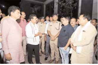
हैं और शांति के प्रतीक हैं।

बलौदाबाजार। डिप्टी सीएम विजय शर्मा ने बलौदाबाजार कलेक्ट्रेट पहुंचकर तोड़फोड़ और आगजनी घटना का जायजा लिया। उन्होंने कलेक्टर और एसपी से घटना की जानकारी ली। पूरे परिसर में हुई आगजनी, जिला पंचायत, कुटुंब न्यायालय और जनपद पंचायत कार्यालय सहित शहर का भी मुआयना कर नुकसानों का जायजा लिया।