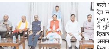
सतनामी समाज के प्रमुखों ने कहा शांति और सौहार्दपूर्ण वातावरण के लिए मिलकर करेंगे कार्य

रायपुर (दावा)। मुख्यमंत्री विष्णु देव साय ने बलौदाबाजार जिले की घटना के संबंध में सतनामी समाज के प्रमुखों से कहा है कि बाबा गुरु दासीदास का संदेश समाज में शांति और सद्भाव का रहा है। आप सबकी भी जिम्मेदारी है कि समाज भ्रमित न हो और शांति स्थापित करने की दिशा में साथ मिलकर आगे बढ़ें।