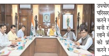
निर्माण कार्य समय सीमा में पूरा करें, प्रगति की सतत समीक्षा हो- सीएम साय

रायपुर (दावा)। विधानसभा अध्यक्ष डॉ. रमन सिंह और मुख्यमंत्री विष्णु देव साय ने आज यहाँ अपने निवास कार्यालय में नवा रायपुर में निर्माणधीन नवीन विधानसभा भवन, विधाक विभाग एवं विधानसभा के अधिकारियों-कर्मचारियों के लिए बन रहे आवासों की प्रगति की समीक्षा की। मुख्यमंत्री ने बैठक में कहा कि निर्माण कार्य अच्छी गुणवत्ता के साथ समय-सीमा में पूर्ण करें। समय-समय पर प्रगति की समीक्षा की जाए। बैठक में उप मुख्यमंत्री अरूण साव, संसदीय कार्य मंत्री बृजमोहन अग्रवाल, वित्त मंत्री ओ. पी. चौधरी, मुख्य सचिव अमिताभ जैन भी उपस्थित थे। विधानसभा अध्यक्ष डॉ. रमन सिंह ने बैठक में कहा कि विधानसभा भवन का निर्माण आने वाली पीढ़ियों को ध्यान में रखकर किया जाना है। हमारा प्रयास यह हो कि पूरा विधानसभा सौर ऊर्जा से संचालित हो। यह पूरे देश के लिए एक उदाहरण बने। उन्होंने कहा कि पूरा परिसर हरित वातावरण से सुसज्जित हो इसलिए