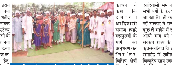
स्वधीनता संग्राम तथा देश के नवनिर्माण में आदिवासी समाज की भूमिका अत्यंत महत्वपूर्ण - मंत्री कश्यप