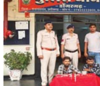
योजना बनाकर, रेकी करके चोरी कार्य को देते थे अंजाम