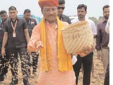
खेती-किसानी को लेकर जरापुर, सरगुजा अंचल के किसानों में ऐसी परंपरा है, जिसमें परिवार के लोग मुखिया के साथ धान की बोनी की रस्म निभाते हैं।

रायपुर (दावा)। मुख्यमंत्री विष्णु देव साय छत्तीसगढ़ राज्य की कमान संभालने के साथ-साथ अपने पारिवारिक जिम्मेदारियों को भी बखूबी संभाल रहे हैं। उन्होंने आज अपने गृह ग्राम बगिया में मानसून की आहट को देखते हुए पुरतैनी खेतों में खेती-किसानी की शुरूआत की। उन्होंने स्वयं एक किसान की तरह धान की बोनी कर परंपरा का निर्वहन किया। मुख्यमंत्री ने परंपरा के मुताबिक पांच बार बीजों को अपने हाथों में लेकर खेतों में बिखरा दिया, इसके बाद परिवारजनों ने भी उनका अनुसरण किया।