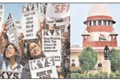
अगर धोखाधड़ी करने वाला कोई व्यक्ति डॉक्टर बन जाए तो वह समाज के लिए और अधिक हानिकारक होगा। हम जानते हैं कि एंटी-कॉरुप्शन को परिणाम घोषित करने वाली एनटीए को नसीहत देते हुए कहा, एक एंटी-कॉरुप्शन के रूप में आपको निष्पक्षता से काम करना चाहिए। यदि कोई गलती हुई है तो 'हाँ' कहें, यह एक

नयी दिल्ली। उच्चतम न्यायालय ने गंभीर अनियमितताओं के आरोपों से घिरी मेडिकल प्रवेश परीक्षा नीट यूजी 2024 रद्द कर इसे दोबारा आयोजित कराने की मांग वाली एक याचिका पर मंगलवार को केंद्र सरकार और राष्ट्रीय एजेंसी (एनटीए) से कहा कि भले ही किसी की ओर से 0.001 फीसदी भी लापरवाही हुई हो, उसे स्वीकार करें और विद्यार्थियों में आत्मविश्वास जगाने के लिए उचित समय पर उचित कार्रवाई कर इस मामले को पूरी तरह निपटया जाना चाहिए।