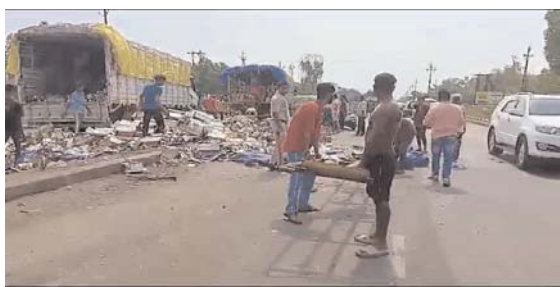
बियर चुराकर भाग रहे लोगों को पकड़ा

राजनांदगांव (दावा)। शहर के बीच रायपुर नाका राम दरबार के पहले औरंगाबाद से उड़ीसा बियर केन भरकर जा रही ट्रक देर रात अनियंत्रित होकर पलट गई, घटना की सूचना मिलने के बाद आबकारी विभाग और पुलिस की टीम मौके पर पहुंची और अपनी सुरक्षा के बीच सुबह एक अन्य ट्रक के माध्यम से नष्ट होने से बची बियर केन को गंतव्य के लिए रवाना किया। औरंगाबाद से 2400 पेटि बियर केन भरकर उड़ीसा जा रही ट्रक देर रात लगभग 1 बजे राजनांदगांव शहर के राम दरबार चौक के समीप एक वाहन को बचाने के फेर में अनियंत्रित होकर पलट गई। हादसे में ट्रक का पिछला हिस्सा पूरी तरह उलट गया, जिससे ट्रक के भीतर रखी 24 सौ पेटियों में से सैकड़ों बियर की केन फूट कर नष्ट हो गईं। देर रात हादसे की सूचना मिलने पर पुलिस विभाग और आबकारी