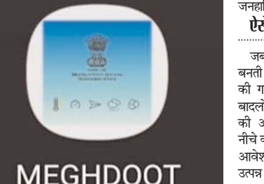
मेघदूत एप का स्क्रीनशॉट

प्रचार-प्रसार करने के साथ ही गांवों में मुनादी करने के निर्देश दिए गए हैं। खेती-किसानी के सीजन में किसानों के लिए मौसम की सटीक जानकारी आवश्यक होती है, इससे खेती-किसानी का काम-काज व्यवस्थित और सुचारू ढंग से करने में मदद मिलती है। मेघदूत एप के माध्यम से किसान भाई मौसम पूर्वानुमान जैसे तापमान, वर्षा की स्थिति, हवा की गति एवं दिशा इत्यादि की जानकारी मिलेगी, जिससे किसान अपने