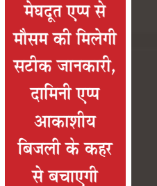
मेघदूत एप से मौसम की मिलेगी सटीक जानकारी, दामिनी एप आकाशीय बिजली के कहर से बचाएगी

राजनांदगांव (दावा)। किसानों और ग्रामीणों के दो सच्चे साथी अब हमेशा उनके साथ रहेंगे। एक उन्हें मौसम संबंधी जानकारी से लैस करेगा, तो दूसरा आकाशीय बिजली की कहर से बचाएगा। छत्तीसगढ़ में मानसून की दस्तक के साथ ही खेती-किसानी का काम-काज शुरू हो जाता है।