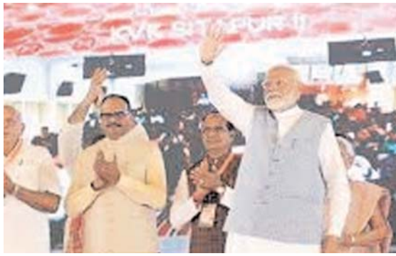
इस अवसर पर उन्होंने यहाँ विशेष रूप से आयोजित पीएम किसान सम्मान निधि कार्यक्रम में भाग लेते हुए कहा, अपने किसानों के सम्मान में बटन दबा कर किसानों के खाते में योजना की 2000-2000 रुपये की किस्त जारी की। श्री मोदी ने सम्मेलन को संबोधित करते हुए कहा, अपने किसान भाई-बहनों का जीवन आसान बनाने के लिए हमारी सरकार प्रतिबद्ध है। काशी की

वाराणसी। प्रधानमंत्री नरेंद्र मोदी ने मंगलवार को वाराणसी में एक मंच से मंगलवार को प्रधानमंत्री किसान सम्मान निधि योजना की 17वीं किस्त जारी की और किसानों को भलाई के लिए अपनी सरकार की प्रतिबद्धता को दोहराया। किसान सम्मान निधि की इस किस्त के माध्यम से देश भर में नौ करोड़ 26 लाख 67 हजार 496 किसानों के खाते में 20 हजार करोड़ रुपये की राशि हस्तांतरित की गयी। इस तरह अब तक इस योजना से किसानों को 3.24 लाख करोड़ रुपये से अधिक की निधि दी जा चुकी है।