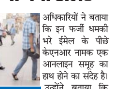
हवाईअड्डों को मिले ईमेल के बाद जांच में इसे अप्रवाह घोषित किया गया, ईमेल के पीछे केएनआर नामक एक ऑनलाइन समूह का हाथ होने का संदेह। उन्होंने बताया कि समूह ने एक मई को दिल्ली-एनसीआर के कई स्कूलों को इसी तरह के ईमेल जारी किए थे। हवाईअड्डों ने इस खतरे को अप्रवाह बताया और सुरक्षा कर्मियों को अप्रवाह बताया और भी फट सकते हैं। आप सभी मर जाएंगे।

नई दिल्ली। देश के 41 हवाईअड्डों को मंगलवार को बम की धमकी वाले ईमेल मिले थे। सुरक्षा एजेंसियों द्वारा जांच के बाद उनमें से प्रत्येक को अप्रवाह घोषित कर दिया गया। अधिकारी ने बताया कि धमकी भरा ई-मेल मंगलवार दोपहर करीब 12.40 बजे मिला, जिसके बाद सुरक्षा कर्मियों को सतर्क किया गया। इसके बाद सभी एयरपोर्ट पर सुरक्षा के पुख्ता इंतजाम किए गए। ईमेल भेजने वाले ने कहा कि हवाई अड्डे पर बम लगाए गए हैं, और वे कभी भी फट सकते हैं। आप सभी मर जाएंगे।