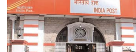
भारतीय डाक INDIA POST

राजनांदगांव (दावा)। नागरिक केन्द्रित सेवाओं, बैंकिंग सेवाओं और सरकारी योजनाओं के लाभ प्रदान करने के लिए एक सरल विधायी ढांचा तैयार करने तथा पत्रों के संग्रह, प्रोसेसिंग और वितरण के विशेषाधिकार जैसे प्रावधानों को समाप्त करने वाला डाकघर विधेयक, 2023 प्रभावी हो गया है।