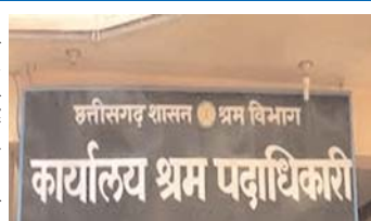
कार्यालय श्रम पदाधिकारी

राजनांदगांव (दावा)। सरकार द्वारा गरीब महिला व दिव्यांग लोगों के सशक्तिकरण के लिए संचालित विभिन्न योजनाओं का लाभ संबंधित हितग्राहियों को मिलता है। उक्त योजनाओं के लाभ के लिए श्रम विभाग में पंजीकरण होना जरूरी है। इन पंजीकृत लोगों द्वारा सम्बंधित योजना के लाभ के लिए श्रम विभाग में आवेदन दिए जाने के उपरांत पास होने पर उक्त योजना से सम्बंधित लाभ के लिए राशि बैंक में भेज दी जाती है। लेकिन श्रम विभाग द्वारा चेक के माध्यम से भेजे गए बैंक में लाभाभित होने वाले हितग्राही का उसके बैंक का सही खाता नं. दर्ज नहीं होने के कारण श्रम विभाग को चेक वापिस कर दिया गया है। इसके कारण कई लोगों के उनके अपने बैंक में उक्त योजना से सम्बंधित राशि नहीं आ पाई है। इस से हितग्राहियों को श्रम विभाग से लेकर सम्बंधित बैंक के चक्कर लगाने पड़ रहे हैं।