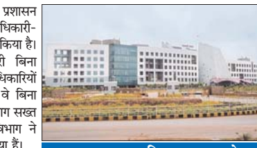
विभाग की ओर से जारी आदेश में लिखा गया है कि, कई मामलों में ये देखने को मिल रहा है कि, व्यक्तिगत समस्या लेकर मंत्रालय में मिलने आते हैं। जबकि उनकी समस्या का समाधान विभागाध्यक्ष कार्यालय या जिला कार्यालय के स्तर से ही किया जा सकता है। फॉलो-अप भी उसी कार्यालय से होगा। इसके लिए कर्मचारियों को मंत्रालय आने या किसी

रायपुर। छत्तीसगढ़ में सामान्य प्रशासन विभाग ने स्वास्थ्य विभाग के अधिकारी-कर्मचारियों के लिए नया आदेश जारी किया है। जिसके तहत कर्मचारी-अधिकारी बिना अपॉइंटमेंट किए मंत्री या सीनियर अधिकारियों से मिलने नहीं जा सकते हैं। यदि वे बिना अपॉइंटमेंट के जाते हैं तो उस पर विभाग सख्त कार्यवाही करेगा। सामान्य प्रशासन विभाग ने बाकायदा इसके लिए निर्देश जारी किया है।