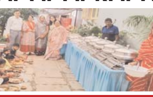
नौ-कन्या भोज सहित दान-पुण्य का बना रहा माहौल

राजनांदगांव (दावा)। जेष्ठ माह के शुक्ल पक्ष की दशमी तिथि को गंगा दशहरा पर्व स्नान-ध्यान व दान पुण्य के कार्यों के साथ मनाया गया। इस दिन पतित पावनी मां गंगा का उद्भव दिवस होने के कारण देहावसित जनों का विध्वि-विधान के साथ श्राद्ध कर्म भी सम्पन्न किया गया। वहीं कई जगह नौ-कन्या भोज भी आयोजित किया। इस दिन समाज सेवी जनों द्वारा शहर में गंगाजल मिश्रित शीतल पेयजल व शर्बत का वितरण किया गया वहीं मंदिरों में गंगा पूजन सहित अन्य अनुष्ठानिक आयोजन सम्पन्न किए गए।