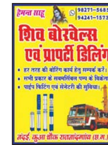
शिव डॉरेवेलस एवं प्रापटी डिलिंग

अधिनियम को 24 दिसंबर 2023 को राष्ट्रपति की सहमति प्राप्त हुई और इसे सामान्य जानकारी के लिए विधि और न्याय मंत्रालय (विधायी विभाग) द्वारा 24 दिसंबर 2023 को भारत के राजपत्र, असाधारण, भाग दो, खंड 1, प्रकाशित किया गया था। इसमें किसी तरह का कोई दंडनीय प्रावधान नहीं है और यह वस्तुओं,