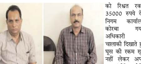
दो अफसरों को रिश्वत लेते दो अफसरों को रंगे हाथों पकड़ा है।