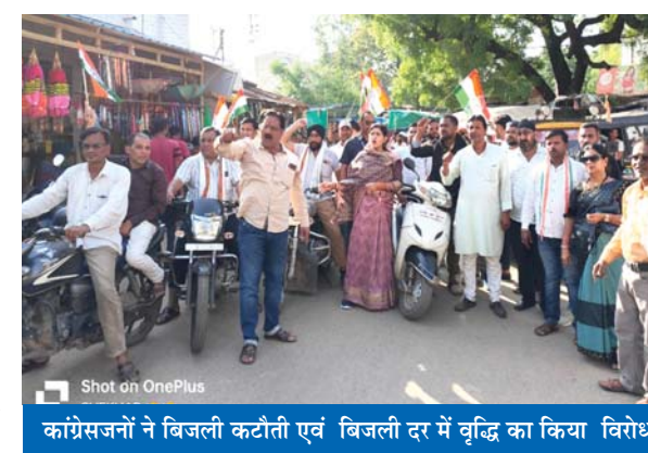
कांग्रेसजनों ने बिजली कटौती एवं बिजली दर में वृद्धि का किया विरोध