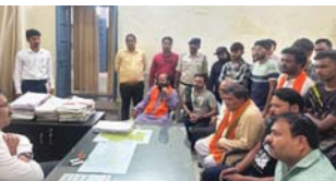
शहर में गौवंशों के उपचार में लापरवाही, बजरंग दल का फूटा गुस्सा

राजनांदगांव (दावा)। शहर में बढ़ते हुए एक्सोडेंटों के बीच बजरंग दल और जीव सेवी संस्थान बड़-चढ़कर आवागमन के घायल होने पर उपचार जैसे प्रबंध कर दे है, वहीं शासकीय पशु चिकित्सालय की बड़ी लापरवाही के चलते गौ वंश मृत्यु को प्राप्त हो रहे है। नगरवासियों द्वारा कुछ दिनों से गौवंशों को बिना उपचार के मीत और शासकीय डॉक्टर की लेटलतीफी पाए जाने पर बजरंग दल का गुस्सा फूटा।