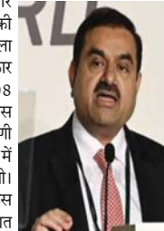
गुजरात सरकार के अलावा बांग्लादेश, अफगानिस्तान, ऑस्ट्रेलिया, न्यूजीलैंड, साउथ अफ्रीका और इंग्लैंड इसमें भाग लेने वाली हैं।

2014 में, राज्य सरकार द्वारा यह कहने के बाद कि चारागाह के लिए 387 हेक्टेयर सरकारी भूमि देने का आदेश दिया गया है, कोर्ट ने मामले का निपटारा कर दिया। फिर 2015 में, राज्य सरकार ने हाई कोर्ट में एक रिव्यू पिटिशन दायर की और कोर्ट से कहा कि ग्राम पंचायत को आवंटित करने के लिए केवल 17 हेक्टेयर भूमि ही उपलब्ध थी। इसने प्रस्ताव दिया कि वह शेष भूमि यहां से लगभग 7 किलोमीटर दूर आवंटित कर सकती है। ग्रामीणों ने इसे यह कहते हुए खारिज कर दिया कि मवेशियों के चरने के लिए यह बहुत दूर है।