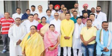
हमने हाफ बिजली बिल योजना से लोगों को राहत दी, भाजपा ने बिजली बिल में वृद्धि कर जनता को किया आहत

राजनांदगांव (दावा)। छत्तीसगढ़ में भाजपा की सरकार आते ही पूरे प्रदेश में कानून व्यवस्था ठप हो चुकी है, रेत माफियाओं का हैसला खुलंद है व नक्सल गतिविधियां बढ़ गई हैं। प्रदेश की भाजपा सरकार छह माह में ही अपना असली चेहरा दिखा रही है, बिजली का कंटेंट देकर प्रदेशवासियों को रूला रही है। उक्त बातें छत्तीसगढ़ के पूर्व मंत्री, पूर्व पीसीसी अध्यक्ष मोहन मरकाम ने राजनांदगांव आवास के दौरान कही। पूर्व प्रदेश अध्यक्ष मोहन मरकाम गुरुवार 11 जुलाई का राजनांदगांव शहर आगमन हुआ, इस दौरान उन्होंने कांग्रेसजनों से भेंट मुलाकात कर दिवंगत कांग्रेसी नेताओं के निवास पहुंचकर शोक संतप्त परिवार से मिलकर उन्हें ढाढस बंधाया।