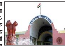
छत्तीसगढ़ विधानसभा में प्रश्न, स्थगन प्रस्ताव व ध्यानाकर्षण को लेकर भी ऑनलाइन प्रक्रिया कर रहे हैं। 22 से 26 जुलाई तक प्रस्तावित सत्र में कांग्रेस के विधायकों ने कानून व्यवस्था समेत तमाम मुद्दों को लेकर राज्य सरकार को घेरने की रणनीति तैयार की है। बताया जाता है कि कांग्रेस कानून व्यवस्था, बलौदाबाजार कांड, मलेरिया, डायरिया आदि मुद्दों पर ध्यानाकर्षण लाएगी। इसके अलावा आरंग मौब लिफ्टिंग, बिजली कटौती, बिजली बिल, गोठों को बंद करने जैसे प्रमुख मुद्दे भी उठेंगे। विष्णु देव साय सरकार में प्रदेश की जर्जर कानून व्यवस्था व शासन प्रणाली के खिलाफ सदन से लेकर सड़क की लड़ाई हम लड़ेंगे। जनता के हित में सारे सवाल पूछे जाएंगे। चाहे कानून व्यवस्था का मामला हो या फिर बलौदाबाजार हिंसा कांड, बेमेतरा कांड, माब लॉफिंग, फर्जी नक्सली मुठभेड़ आदि मुद्दों पर सरकार से सवाल पूछेंगे।

हालांकि सुदूर अंचल के कुछ विधायक अभी भी पूरी तरह से डिजिटल होने में खुद को असहज पा रहे हैं। विधानसभा के वरिष्ठ सूचना अधिकारी जीएस सलूजा ने बताया कि विधानसभा में कागज यानी पेपर को कम करने के लिए प्रक्रिया चल रही है। अब प्रशासनिक प्रतिक्रिया की हाई कपी केवल विधानसभा के सदस्यों को दी जाती है। बाकी पत्रकार