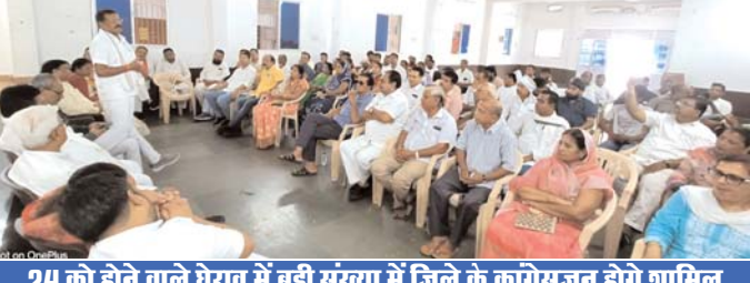
24 को होने वाले घेराव में बड़ी संख्या में जिले के कांग्रेसजन होंगे शामिल