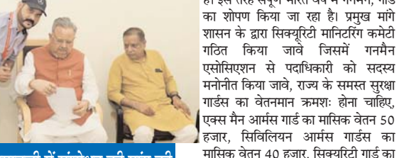
नियमावली में संशोधन की मांग की