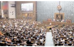
पिछले सत्र के अंत के बाद मणिपुर का दौर किया। राहुल लगातार मणिपुर मुद्दे पर प्रधानमंत्री को निशाना बना रहे हैं। मणिपुर में हिंसा की घटनाएं फिर से बढ़ रही हैं। विपक्ष इस मुद्दे को लेकर लगातार केंद्र सरकार पर निशाना साध रहा है। मणिपुर में ताजा हिंसा के बाद विपक्ष मानसून सत्र के दौरान यह मुद्दा उठा सकता है।