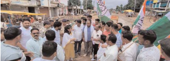
0 निर्माणाधीन नेशनल हाईवे झलमला बालोद से कोहका के मध्य कहराव, जबकसा, कोरकोटटी नाला का पुलिया एप्रोच रोड बहने से मानपुर क्षेत्र के 60-70 गांवों का संपर्क मानपुर ब्लाक मुख्यालय से टूटा 0 एक सप्ताह में व्यवस्था दुरुस्त करने की मांग अन्त्या कांग्रेस कार्यकर्ताओं ने दी सड़क में आने की चेतावनी

व्यापारी लेन देन के लिए मानपुर पहुंच पा रहे हैं। इधर पहले से ही निर्माणाधीन नेशनल हाईवे के अफसरों की लापरवाहियों व निर्माण कार्य की धीमी गति को लेकर परेशान ग्रामीणों का गुस्सा नेशनल हाईवे में कहराव, जबकसा, कोरकोटटी एप्रोच रोड व पुलिया के बह जाने से फूट पड़ा है। ग्रामीणों ने बताया की निर्माण कार्य की गति इतनी धीमी है की पिछले दो वर्ष से उन्हें नेशनल हाईवे के अधिकारियों की लापरवाही व उदासीनता का खामियाजा भुगतना पड़ रहा है। कांग्रेस कार्यकर्ताओं ने किया चक्काजाम मानपुर क्षेत्र के कांग्रेस कार्यकर्ताओं ने आज युवक कांग्रेस के बैनर तले मानपुर ब्लाक मुख्यालय में नेशनल हाईवे में तकरीबन आधा घंटा चक्काजाम किया। भाजपा सरकार के खिलाफ आंदोलन के लिए सड़क पर आए कांग्रेस कार्यकर्ता शासन प्रशासन से जल्द से जल्द पुलिया व एप्रोच रोड को दुरुस्त कर आवागमन बहाल करने की मांग कर रहे थे। कांग्रेसियों का आरोप था की जब से भाजपा सरकार आई है नेशनल हाईवे का निर्माण कार्य की गति और भी धीमी हो गई है। निर्माण कार्य में भारी गड़बड़ियां की जा रही है। जिसके कारण ही निर्माणाधीन नेशनल हाईवे में कई स्थानों में पुलिया व एप्रोच रोड बह गया है।