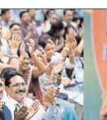
विभाग के सचिव की टीम 30 दिन में सरकार को सौंपेगी रिपोर्ट

रायपुर। छत्तीसगढ़ के पंचायत सचिवों की नौकरी सरकारी होने जा रही है। पंचायत सचिवों के शासकीयकरण को लेकर सरकार ने समिति का गठन किया है। प्रदेश के पंचायत विभाग के सचिव को समिति का प्रमुख बनाया गया है। यह समिति 30 दिन के अंदर अपनी रिपोर्ट सरकार को सौंपेगी। प्रदेश में करीब 6000 पंचायत सचिव हैं। मुख्यमंत्री के निर्देश के बाद समिति का गठन किया गया है। दरअसल, 7 जुलाई को पंचायत दिवस के दिन रायपुर में मुख्यमंत्री ने पंचायत सचिवों से उनके शासकीयकरण का वादा किया था। तब मुख्यमंत्री प्रदेश