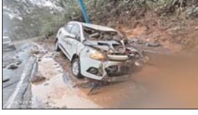
जल जमाव होने से जेसीबी मशीन से रोड की साफ-सफाई की गई। जिला प्रशासन ने निचली बस्तियों में जलभराव को देखते हुए लोगों को सुरक्षित स्थानों पर शिफ्ट किया जा रहा है। इसके साथ ही जिला प्रशासन मीके पर तैनात होकर रेस्क्यू कर रहा है। प्रभावित परिवारों को मंगल भवन में उधरया गया है। इस दौरान द्यूशन पढ़ाने जा रहे बच्चे, जो बाढ़ की चपेट में आ गए थे उन्हें भी रेस्क्यू कर बचाया गया। उनको अस्पताल में भर्ती कराया गया है। वर्तमान में उनकी स्थिति सामान्य है। जिला प्रशासन ने लगातार भारी बारिश के कारण

दत्तेवाड़ा। इस बार की बारिश आपत बनकर आई है। लोग आये दिन भारी बारिश से परेशान हैं। छत्तीसगढ़ के दत्तेवाड़ा जिले के किरंदुल नगर में अतिवृष्टि के कारण रिवार को एनएमडीसी का डैम टूट गया। बंगाली कैम्प के ऊपर 11-सी का बांध टूटने से कई मकान पानी की जद में आ गये। पानी का रौद्र रूप देखकर सभी लोग सहम गये। कई लोग जान बचाकर भागे। इस दौरान कई गाड़ियां पानी में बह गईं तो कई जद्दोजद्द करती दिखीं। ऐसे में लापता छह वर्षीय बालक घंटों मशकत के बाद वापस मिला। सोशल मीडिया पर कई खतरनाक वीडियो सामने आ रहे हैं। अधिक बारिश होने के कारण डैम क्षतिग्रस्त हो गया। इस वजह से कई घर बाढ़ की चपेट में आकर क्षतिग्रस्त हो गए हैं। इस संबंध में जिला प्रशासन ने तत्काल लोगों को सुरक्षित स्थान ले जाया गया है। इसके अलावा किरंदुल के गाेर पुलिस एवं सीएससी सेंटर के पास भी बारिश के