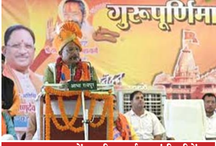
छात्रावास जुगोंरा की बढ़ाई जाएगी सीटें