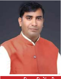
कहा - हितग्राहियों की पुराने व नए राशि जल्द से जल्द स्वीकृत करें

अभी भी राजनांदगांव जिले के लगभग 50 हजार हितग्राही की स्वीकृति अटकी हुई है। शहरी और ग्रामीण क्षेत्रों में प्रधानमंत्री आवास योजना का बुरा हाल है। हितग्राही अपने आवास के लिए नगर निगम और जिला पंचायत तथा जनपद पंचायत के चक्कर काट रहे। फिर