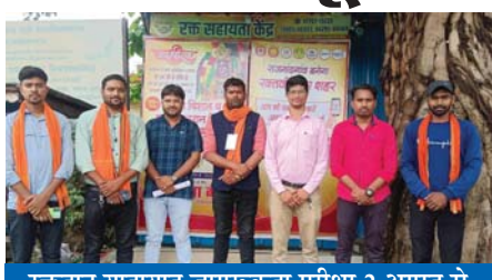
रक्तदान यातायात जागरूकता परीक्षा 2 अगस्त से