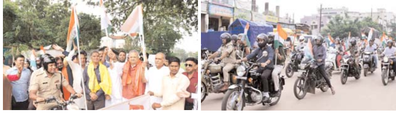
देश की आजादी के लिए अपना सर्वस्व अर्पित करने वाले स्वतंत्रता संग्राम सेनानियों के त्याग एवं बलिदान के प्रति सम्मान में सभी निभाएं अपनी सहभागिता

• तिरंगा का यह गौरव और सम्मान हर घर तक पहुंचे इस संदेश के साथ बाईक रैली का काफिला विभिन्न चौक-चौराहों से गुजरा • देशभक्ति का जज्बा लिए हाथों में तिरंगा झंडा लेकर उत्साह एवं उल्लास के साथ तिरंगा बाईक रैली निकली