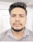
कोचियों को अवैध रूप से बड़ी मात्रा में उपलब्ध कराता था शराब

राजनांदगांव (दावा)। बसंतपुर को अवैध लाभ अर्जित करने के उद्देश्य से बिन्नी हेतु परिवहन करते घेरावदी कर उसे गौरव पथ अस्पताल कालोनी, पानी टकी के पास मेन रोड में पकड़ा गया। पुलिस ने आरोपी के पास से कुल 249 पाँचवा देशी शराब जमला 44.820 बल्क लीटर देशी शराब कीमत 22,410 रुपये एवं एक नीले रंग की एक्टवा क्रामाक सीजी-08/ए एन 0746 कीमती 40 हजार रुपये तथा आरोपी द्वारा उपयोग किये गये मोबाइल वन फ्लस कीमती 15 हजार कुल कीमती 77,410 रुपये को धारा 34 (2) आवकरी एक्ट के तहत जब्त किया गया है।