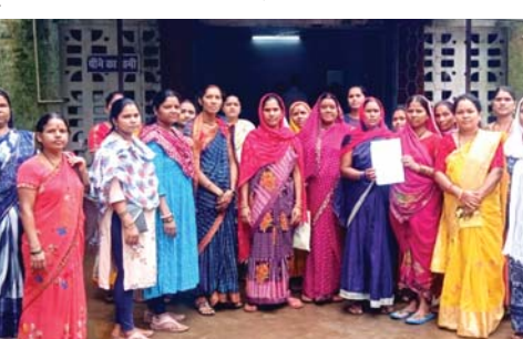
विधायक के गृहवाड़ी स्थित स्वामी आत्मानंद अंग्रेजी माध्यम स्कूल का मामला

अंदाजा लगाया जा सकता है कि पार्षदगण कितने सक्रिय है या पार्षदगणों पर वार्ड की महिलाओं का कितना विश्वास है। इसी वार्ड में नवनिर्वाचित कॉलेज कांग्रेस कमेटी के अध्यक्ष भी निवासरत है। जो वर्तमान में विभिन्न मुद्दों को लेकर सक्रियता के साथ शासन प्रशासन का विरोध कर रहे हैं। गंदगी के कारण बच्चों का खाना पीना दुर्गर हुआ - अभिभावकगण स्कूल में स्थित शौचालय की साफ सफाई की उचित व्यवस्था नहीं होने एवम वहां व्याप्त गंदगी को लेकर बच्चों के अभिभावकगणों ने एसडीएम को दिए गए अपने ज्ञापन में कहा है कि, स्वामी आत्मानंद अंग्रेजी माध्यम स्कूल और साथ में संचालित इग्नाइट अंग्रेजी माध्यम स्कूल में अध्ययनरत शहर व ग्रामीण क्षेत्र से आने वाले बच्चों को शौच आदि के लिए भारी परेशानियों का सामना करना पड़ रहा है। बच्चे सुबह से शाम तक स्कूल में रहते हैं। लेकिन घर आकर ही बच्चे घर के शौचालय का उपयोग करते हैं। और पानी पीते हैं। स्कूल का शौचालय बहुत गंदा रहता है। रोज सफाई नहीं होती है। जिसके कारण बच्चों को विशेष कर लड़कियों को बार-बार यूरिन इन्फेक्शन हो रहा है और वे बार-बार बीमार पड़ रहे हैं। इस बात की सूचना स्कूल के प्राचार्य सहित सर