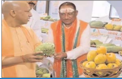
मुख्यमंत्री बोले, इन आमों में भी राम की यादें, ऐतिहासिक रूप से उत्तर-प्रदेश और छत्तीसगढ़ की भावनाएं एक

रायपुर (दावा)। उत्तर-प्रदेश के मुख्यमंत्री योगी आदित्यनाथ से उपहार में काकोरी-आमों का टोकरा पाकर छत्तीसगढ़ के मुख्यमंत्री विष्णु देव साय ने उन्हें पत्र लिखकर कहा है- यह उपहार पाकर मैं भावुक और अभिभूत हूँ। प्रभु श्रीराम जब भी निहाल आते रहे होंगे, तब उनके साथ रसीले आमों के टोकरे भी जरूर आते रहे होंगे, तभी छत्तीसगढ़ के आमों में भी ऐसा ही स्वाद है। वनवास के समय यहां के आम हमारे रामलला को वहां के आमों की अवश्य याद दिलाते रहे होंगे।