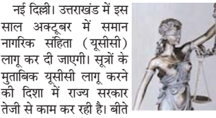
यूसीसी को लेकर क्या बोले थे पुष्कर सिंह धामी

नई दिल्ली। उतराखंड में इस साल अक्टूबर में समान नागरिक संहिता (यूसीसी) लागू कर दी जाएगी। सूत्रों के मुताबिक यूसीसी लागू करने की दिशा में राज्य सरकार तेजी से काम कर रही है। बीते दिनों मुख्यमंत्री पुष्कर सिंह धामी ने भी संकेत दिए थे कि प्रदेश में जल्द ही यूसीसी लागू किया जा सकता है। राष्ट्रपति द्रौपदी मुर्मू राज्य सरकार द्वारा पारित विधेयक को इस साल मार्च में ही मंजूरी दे चुकी है। यूसीसी के तहत अब राज्य में विवाह, तलाक, उत्तराधिकारी और लिव इन रिलेशनशिप को नियंत्रित किया जाएगा। यूसीसी के लागू होने के बाद प्रदेश के सभी निजी कानूनों