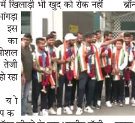
नई दिल्ली। पेरिस ओलंपिक 2024 में बॉन्ज मेडल जीतकर भारत लौटी मेन्स हॉकी टीम का जयें-शोरों से स्वागत हुआ है। 10 अगस्त को दिल्ली एयरपोर्ट पर जब टीम पहुंची, तो जश्न का माहौल था, जहां दोलन-नगाड़े बज रहे हैं। ऐसे में खिलाड़ी भी खुद को रोक नहीं पाए और भांगड़ा करने लगे। इस सैलिब्रेशन का वीडियो सोशल मीडिया पर तेजी से वायरल हो रहा है।

हुआ था। पेरिस से भारत लौटी भारतीय हॉकी टीम की प्लेनइंट दिल्ली एयरपोर्ट पर आई, जहां बाहर उनका दोलन-नगाड़ों के साथ स्वागत हुआ। खिलाड़ियों ने भी इस पल को खूब इज्जत किया।