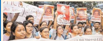
आंख-मुंह, प्राइवेट पार्ट से खून बहा, गर्दन टूटी

कोलकाता। पश्चिम बंगाल से इंसानियत को शर्मसार कर देने वाली घटना सामने आई है। कोलकाता के सरकारी अस्पताल में शुक्रवार को एक ट्रेनी लेडी डॉक्टर को आंख-मुंह और प्राइवेट पार्ट से खून बह रहा था। डेड बॉडी अर्धनग्न अवस्था में मिली थी। इसे लेकर पश्चिम बंगाल में आक्रोश व्याप्त है। पुलिस ने एक आरोपी को गिरफ्तार किया। सीएम ममता बनर्जी ने कहा कि आरोपियों को फांसी की सजा दिलाएंगे। आरजी कर मेडिकल कॉलेज में महिला डॉक्टर पीजी सेक्टर इंगर की छात्रा थीं। तीसरे फ्लोर पर सेमिनार हॉल के अंदर लेडी डॉक्टर की डेड बॉडी सदिग्ध हालत में मिली। पुलिस ने शव को कब्जे में लेकर पोस्टमार्टम के लिए भेज दिया। पोस्टमार्टम रिपोर्ट में खुलासा हुआ कि पहले महिला डॉक्टर के साथ रेप किया गया और फिर उसकी हत्या कर दी गई। ऑटोप्सी रिपोर्ट के अनुसार, महिला डॉक्टर के पेट, बाएं पैर, दाहिने हाथ, गर्दन, छोटी अंगुली और होठों पर चोट लगी थी। चेहरे पर नाखून के निशान थे। दोनों आंखों और मुंह से खून निकल रहा था। प्राइवेट पार्ट से भी खून बह रहा था। उसकी गर्दन की भी हड्डी टूट थी। इससे ऐसा लग रहा है कि आरोपी ने पहले रेप किया और फिर गला घोटकर हत्या कर दी। हालांकि, पुलिस पूरी पोस्टमार्टम रिपोर्ट का इंतजार कर रही है।