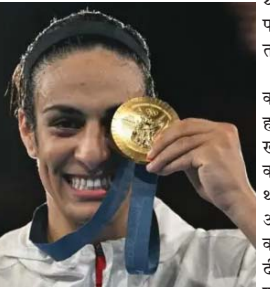
ईमान खलीफा ने फाइनल में भी एकतरफा जीत हासिल की। गोल्ड मेडल के लिए खेले गए फाइनल में ईमान ने चीन की यांग लियू को 5-0 से हराया। इस तरह उन्होंने विवादों के बीच पेरिस ओलंपिक में गोल्ड जीता।

नई दिल्ली। पेरिस ओलंपिक 2024 में बॉन्ज मेडल जीतकर भारत लौटी मेन्स हॉकी टीम का जयें-शोरों से स्वागत हुआ है। 10 अगस्त को दिल्ली एयरपोर्ट पर जब टीम पहुंची, तो जश्न का माहौल था, जहां दोलन-नगाड़े बज रहे हैं। ऐसे में खिलाड़ी भी खुद को रोक नहीं पाए और भांगड़ा करने लगे। इस सैलिब्रेशन का वीडियो सोशल मीडिया पर तेजी से वायरल हो रहा है।