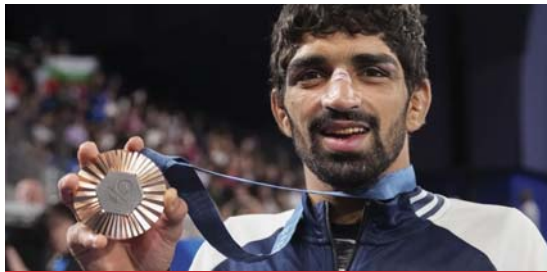
सबसे कम उम्र के भारतीय व्यक्तिगत पदक विजेता बने

यह पेरिस ओलंपिक में भारत का छठा पदक है, जिसमें देश ने अब तक एक रजत और पांच कांस्य पदक हासिल किए हैं। दल में एकमात्र पुरुष पहलवान सहरावत ने मुकाबले का पहला अंक गंवा दिया,