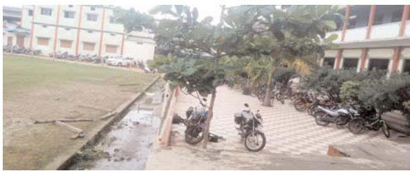
ग्रीन ग्रास मैदान के लिए पूरे स्कूल को कैम्प किए जाने से स्कूल का बुरा हाल, स्टाफ की कमी, सफाई व्यवस्था का अभाव झेल रहा स्कूल, पीएम श्री स्कूल का अता-पता नहीं, अभी भी संचालित हो रहा स्वामी आत्मानंद स्कूल, पैसे लेकर प्रवेश दिए जाने की शिकायत

बहाता उजाड़ पड़ा हुआ है जहां प्रायः असामाजिक तत्वों का डेरा बना रहता है। बताया जाता है कि स्कूल छूटने के समय इन तत्वों की यहां पहुंचने वाली छात्राओं पर बुरी नजर बनी रहती है। स्कूल कैम्पस में रखी बाहनें भी आए दिन चोरी होने की शिकायतें हैं। झंडा फहराने की जगह नहीं बता दे कि महंत सर्वेश्वर दास हाई स्कूल के मैदान को ग्रीन ग्रास बिछाने के लिए कैम्प कर दिए जाने से यहां दोनों राष्ट्रीय पर्वों में झंडा फहराने के लिए जगह नहीं रह गया है। यहां झंडा फहराने का स्थान स्कूल के प्रार्थना स्थल के पास ही बना हुआ है लेकिन वह कटीले तारों से बाउंड्रीवाल कर तिलों से घेर दिए गए जाने से स्कूल वालों को महंत सर्वेश्वरदास स्कूल के ऊपर में झंडा फहराना पड़ता है। बताया जाता है कि अभी वह ग्रीन ग्रास वाला स्कूल मैदान हार्टिकल्चरल वालों के अंडर में है। इसके चलते स्कूल प्रबंधन उस मैदान में अनाधिकार चेष्टा नहीं कर पाता। प्रबंधन का कहना है कि इसे स्कूल को सौंप दिया जाए तो यहां पर किसी प्रकार की समस्या नहीं रह जाएगी। आत्मानंद स्कूल समालोचिता बता दे कि कांग्रेस शासनकाल में जिन स्कूलों