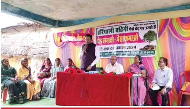
हरियाली बहिनी कार्यक्रम अंतर्गत ग्राम रूसे में लगाए गए फलदार पौधे