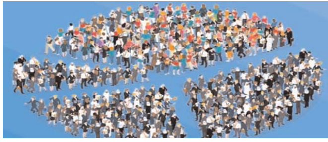
भारत पहले राजा-महाराजा और जमींदार प्रधान देश था। आजादी के बाद कृषि प्रधान हो गया। धीरे-धीरे कुछ किसानों का खेती से मोहभंग हो गया और वे राजनीति में उतर आए। इस बीच सिपायसी दलों ने उगना शुरू कर दिया जिससे देश नेता और राजनीति प्रधान हो गया। तत्पश्चात विकास का क्रम प्रारंभ हुआ। सबसे पहले नेताओं ने अपना विकास किया।

यहाँ हर आदमी ज्ञानी, दूसरा महजानी, तीसरा घनघोर ज्ञानी और चौथा पहुँचा हुआ होता है। मगर जाति के बिना काम नहीं चलता। न चुनाव में और न चुनाव के बाद संसद में। ऊपर वाला जब किसी को दुनिया में भेजता है तो सिर्फ इंसान बनाकर उसे जाति और मजहब का चोला वे लोग पहनाने हैं, जिन्हें पहले इंसान बनाकर भेजा गया था। इस प्रकार संस्कारों की रासायनिक प्रतिक्रिया में इंसान खत्म हो जाता है और सिर्फ जाति और मजहब रह जाता है। भारत पहले राजा-महाराजा और जमींदार प्रधान देश था। आजादी के बाद कृषि प्रधान हो गया। धीरे-धीरे कुछ किसानों का खेती से मोहभंग हो गया और वे राजनीति में उतर आए। इस बीच सिपायसी दलों ने उगना शुरू कर दिया, जिससे देश नेता और राजनीति प्रधान हो गया। तत्पश्चात विकास का क्रम प्रारंभ हुआ। सबसे पहले नेताओं ने अपना विकास किया। तत्पश्चात भाई-भतीजा-पत्नी आदि स्वजनों का। देश में गरीबी हटाओ का नारा दिया गया और अपनी सात पुश्तों तक की गरीबी हटा दी गई। जात