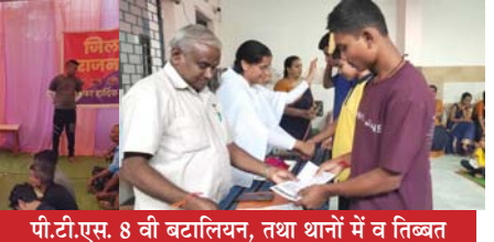
पी.टी.एस. 8 वीं बटालियन, तथा थानों में व तिब्बत सीमा पुलिस बल के जवानों को तथा जिला जेल के बंदी भाईयों को ब्रह्माकुमारी बहनों राखी बांधी