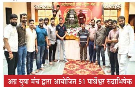
अग्र युवा मंच द्वारा आयोजित 51 पार्थेश्वर रुद्राभिषेक

रायपुर (दावा)। अभनपुर छत्तीसगढ़ी अग्र युवा मंच रायपुर इकाई द्वारा 51 पार्थेश्वर रुद्राभिषेक शिवमय सावन आशुतोष अलका मंगल भवन अभनपुर में आयोजित हुआ।