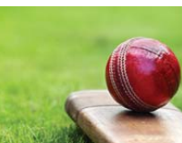
ध्वस्त किए, बल्कि समोआ को एक मजबूत स्कोर तक भी पहुंचाया। उनकी 132 रनों की पारी, जिसमें 14 छक्के शामिल थे - टी20 इतिहास में पांचवां सबसे बड़ा स्कोर। समोआ के अंतिम स्कोर 174 का 75.86 था, जो टी20 पारी में किसी