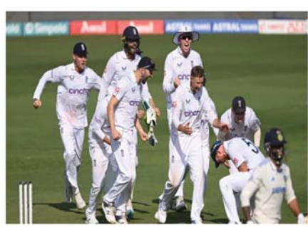
का हिस्सा हैं। टीम में डैन लॉरेंस की भी वापसी हुई है। वो सलामी बल्लेबाज के रूप में दिखाई देंगे। श्रीलंका के खिलाफ पहले टेस्ट मैच में इंग्लैंड ने युवा बल्लेबाज ओली पोप को कप्तान बनाया है। वो बेन स्टोक्स की जगह टीम की कप्तान संभालेंगे। टीम के उपकप्तान के रूप में हैरी ब्रूक नजर आएंगे। हैरी ब्रूक ने अपने हालिया प्रदर्शन से सभी को प्रभावित किया है। इंग्लैंड की टीम के हैसिले इस समय काफी ज्यादा बुलंद है।

नई दिल्ली। श्रीलंका और इंग्लैंड के बीच पहला टेस्ट मैच बुधवार (21 अगस्त) से मैनचेस्टर में खेला जाएगा। इस टेस्ट मैच के लिए इंग्लैंड ने अपनी प्लेइंग इल्लु का ऐलान कर दिया है। मांसपेशियों में खिंचाव की वजह से टीम के नियमित कप्तान बेन स्टोक्स इस मैच में खेलते हुए नजर नहीं आएंगे। उनके अलावा उंगली में चोट की वजह से जैक क्रॉडली भी इस मुकाम से बाहर हो गए हैं। इंग्लैंड की टेस्ट टीम में एक साल के बाद मैथ्यू पॉट्स की वापसी हुई है। उन्होंने अपना आखिरी टेस्ट मैच जून 2023 में खेला था। इंग्लैंड के लिए मैथ्यू पॉट्स ने अभी तक 6 टेस्ट मैच खेले हैं। हालांकि वो इंग्लैंड की वनडे टीम