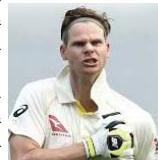
उन्होंने ओलंपिक्स में खेलने पर कहा, मैं शायद चार साल बाद भी टी20 क्रिकेट का हिस्सा बना रहूंगा। दुनिया में काफी फ्रेंचइजी क्रिकेट खेला जा रहा है और मैंने अभी सिडनी सिक्सर्स के साथ 3 साल की डील साइन की है। ओलंपिक्स उसके एक साल बाद ही होगा। ओलंपिक्स का हिस्सा बनना एक खास लक्ष्य होगा। स्टीव स्मिथ की उम्र तब तक 39 साल की हो चुकी होगी। ऐसे में सवाल है कि क्या यह ऑस्ट्रेलियाई खिलाड़ी तब तक रिटायर हो चुका होगा। इस पर स्मिथ ने कहा, मेरा रिटायरमेंट का कोई प्लान नहीं है। मैं क्रिकेट को फिलहाल इंजॉय कर रहा हूँ। मैं अच्छे महसूस कर रहा हूँ और इस समर सीजन पर मेरी नजर है। मुझे लगता है कि भारत के खिलाफ सीरीज चुनौतीपूर्ण रहेगी क्योंकि उनकी टीम काफी बड़िया है।

नई दिल्ली। हल ही में पेरिस ओलंपिक्स 2024 का समापन हुआ है, लेकिन क्रिकेट फैंस के अंदर अभी से अगले ओलंपिक खेलों के प्रति रोमांच बढ़ने लगा है। ऐसा इसलिए क्योंकि 2028 लॉस एंजेलिस ओलंपिक्स में क्रिकेट की एंट्री होने वाली है। खेलों इस इस महाकुंभ में टी20 फॉर्मेट का क्रिकेट खेला जाएगा। इस विषय पर अब ऑस्ट्रेलिया टीम के पूर्व कप्तान स्टीव स्मिथ ने चुप्पी तोड़ी है कि उनका ओलंपिक्स में क्रिकेट खेलने पर क्या विचार है? बता दें कि टी20 वर्ल्ड कप 2024 में ऑस्ट्रेलिया को निराशाजनक प्रदर्शन के बाद डेविड वॉर्नर ने क्रिकेट से संन्यास ले लिया था। ऐसे में क्यास लगाए जाने लगे थे कि 35 वर्षीय स्मिथ भी खासतौर पर क्रिकेट के छोटें फॉर्मेट को अलविदा कह सकते हैं। मगर अब