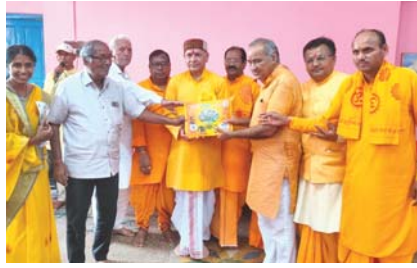
गायत्री परिवार के जिला बैठक में विभिन्न विषयों पर हुई चर्चा परियोजनाओं को सौंपे गये अनेक दायित्व