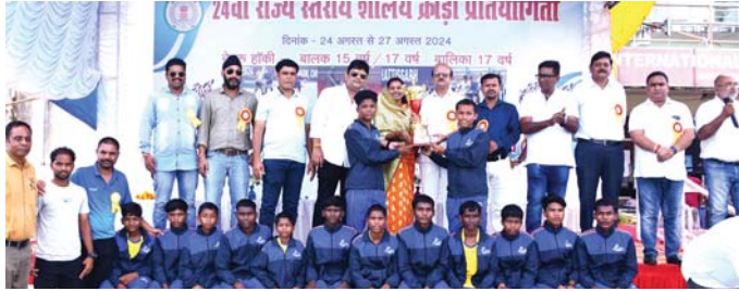
24वीं राज्यस्तरीय शालेय क्रीडा प्रतियोगिता का हुआ समापन