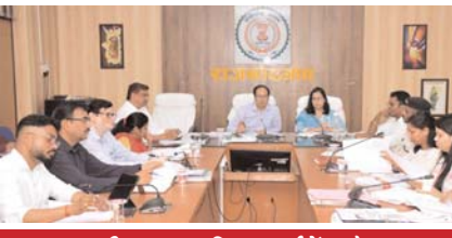
शराब पीकर तथा बिना लाईसेंस के वाहन चलाने वालों पर कार्रवाई करने के लिए निर्देश

के वजन ल्यूहार 9 से 19 सितम्बर तक मनाया जाएगा। इसमें बच्चों, किशोरी बालिकाओं, महिलाओं का स्वास्थ्य को ध्यान में रखते हुए समग्र पोषण के लिए विशेष तौर पर सभी कार्य करें। कलेक्टर ने कहा कि सड़क दुर्घटना के दृष्टिगत घुमंतू पशुओं को सड़क से हटाने के लिए कार्रवाई में तेजी लाने की आवश्यकता है। इसके लिए जनसामान्य को जागरूक करने की जरूरत है। इसके लिए लगातार निरीक्षण करते रहें। सड़क सुरक्षा के संबंध में जानकारी लेते हुए ब्लैक स्पॉट के चिन्हकन तथा ऐसे स्थानों में रबल स्टेप बनाने के निर्देश दिए। उन्होंने शराब पीकर वाहन चलाने वाले तथा बिना लाईसेंस के वाहन चलाने वालों पर कार्रवाई करने के निर्देश दिए। उन्होंने निलंबित एवं निरस्त किए गए लाईसेंस के संबंध में जानकारी