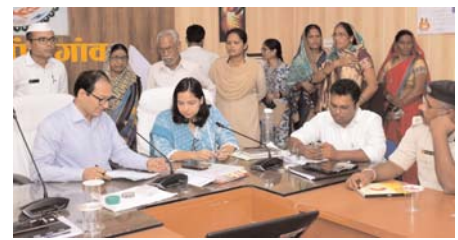
विभागीय अधिकारियों को जनसामान्य की समस्याओं को शीघ्र निराकरण करने के लिए निर्देश