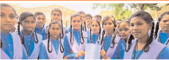
मामला - खैरागढ़ विकासखंड के ग्राम मुद्दीपार स्थित हायर सेकेंडरी स्कूल