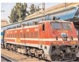
आठ ट्रेनों को रद्द किया जा चुका है। इसके कारण 30 हजार से अधिक यात्रियों के सफर पर प्रभाव पड़ा है।