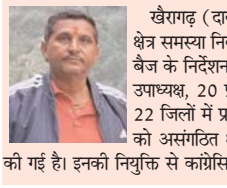
खैरागढ़ (दावा)। छत्तीसगढ़ कांग्रेस में बदलाव का दौर शुरू हो गया है और असंगठित क्षेत्र समस्या निवारण प्रकोष्ठ की कार्यकर्णी गठित की गई है। प्रदेश कांग्रेस अध्यक्ष दीपक बैज के निर्देशन के बाद महामंत्री मलकीत सिंह गैट्ट ने सूची जारी की है जिसमें 5 प्रदेश उपाध्यक्ष, 20 प्रदेश महासचिव और 32 सचिवों की नियुक्ति की गई है। इसी के तहत 22 जिलों में प्रकोष्ठ के अध्यक्षों की घोषणा की गई है। केसीजी जिले से यतेंद्रजीत सिंह को असंगठित क्षेत्र समस्या निवारण प्रकोष्ठ के प्रथम जिला अध्यक्ष के पद पर नियुक्ति की गई है। इनकी नियुक्ति से कांग्रेसियों में हर्ष है।