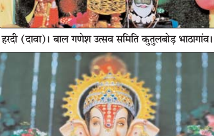
हरदी (दावा)। बाल समाज दुर्गा चौक हरदी।