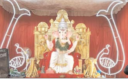
छुईखदान (दावा)। छुईखदान का राजा।