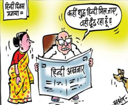
हिन्दी दिवस प्रत्याया