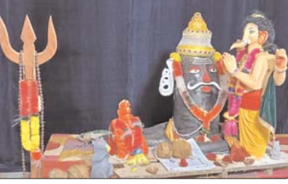
छुईखदान (दावा)। राजमहल महाकाल गणेश समिति छुईखदान