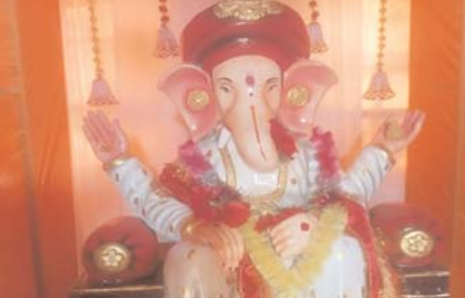
हरदी (दावा)। जय महाकाल गणेश उत्सव समिति भरदा।