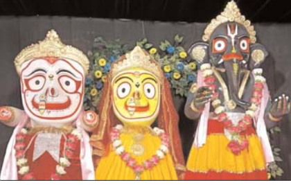
छुईखदान (दावा)। श्री राम गौरीशेवदा समिति काली मंदिर छुईखदान