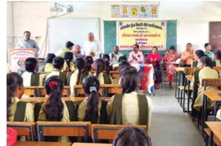
विद्यार्थियों का उत्साहवर्धन कर बेहतर पढ़ाई के लिये किया प्रेरित