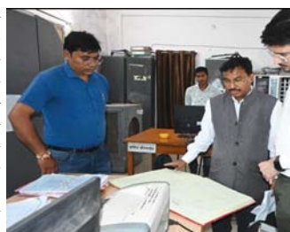
खनिज शाखा के लेखापाल को कारण बताओ नोटिस जारी, कार्यालय जिला पंचायत को 3 दिन के भीतर केश बुक पूर्ण करने के लिए निर्देश