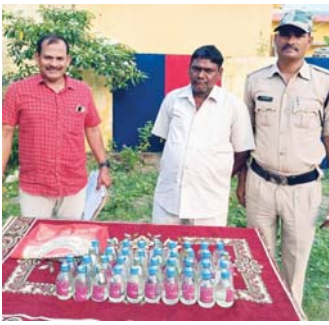
आबकारी एक्ट के तहत एक को भेजा गया जेल

डोंगरगांव (दावा)। थाना क्षेत्र डोंगरगांव करियाटोला के नहर नाली के समीप अवैध शराब बिक्री पर रेड कार्यावाही कर एक व्यक्ति को गिरफ्तार किया गया है। थाने से मिली जानकारी के अनुसार पुलिस अधीक्षक