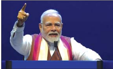
अमेरिका-इंडिया दुनिया का नया एआई पावर

न्यूयॉर्क। प्रधानमंत्री नरेंद्र मोदी न्यूयॉर्क के नासाऊ कोलोनियम में प्रवासी भारतीयों को संबोधित कर रहे हैं। सबसे पहले पीएम ने लोगों को नमस्ते करते हुए कहा कि अब तो अपना नमस्ते भी लोकल हो गया है। आपका प्यार मेरे लिए सौभाग्य है। इस दौरान पीएम मोदी की अमेरिका में जय जयकार के नारे लगे। प्रधानमंत्री ने कहा दुनिया अब डिजाइन ऑफ इंडिया का जलवा देखेगी। प्रधानमंत्री मोदी ने न्यूयॉर्क के नासाऊ कोलोनियम में प्रवासी भारतीयों को संबोधित कर रहे हैं। पीएम ने अपने संबोधन में कहा कि अब अपना नमस्ते भी लोकल से ग्लोबल हो गया है। मोदी ने कहा कि मां भारतीय ने जो हमें सिखाया हम उसको कभी भूल नहीं सकते। भारतीयों के टैलेंट का कोई मुकाबला नहीं है। हम जहां भी जाते हैं सबको परिवार मानकर उनसे घुल मिल जाते हैं। पीएम ने कहा कि हम उस देश के वासी हैं जहां सैकड़ों भाषाएं हैं, बोलियाँ हैं, दुनिया के सारे मत हैं पंथ हैं फिर भी हम एक बकर नक बनकर आगे बढ़ रहे हैं। पीएम मोदी ने कहा कि मेरे जीवन का एक बहुत बड़ा हिस्सा ऐसा रहा, जिसमें मैं सालों साल तक पूरे देश में घूमा। जहाँ, खाना मिला वहाँ खा लिया, जहाँ सोने के लिए मिला वहाँ सो गया। हर क्षेत्र के लोगों से मिला और उनको जानने समझने का प्रयास किया।