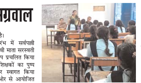
गृह विज्ञान विभाग में विश्व स्तनपान दिवस पर व्याख्यान आयोजित

काफी परिवर्तन आया है। आयोजन के शुभारंभ में सर्वपल्ली राधाकृष्णन ज्ञान की देवी माता सरस्वती को नमन करते हुए दीप प्रचलित किया गया। उपस्थित सभी शिक्षकों का पुष्प माला, तिलक लगाकर स्वागत किया गया। विद्यार्थियों की ओर से आयोजित प्रतियोगिताओं के पुरस्कार दिये गये छात्रों द्वारा आकर्षक सांस्कृतिक आयोजन, खेल प्रतियोगिता, अनुभव कथन आदि गतिविधियों की गई, सुंदर भजन भी प्रस्तुत किया गया।