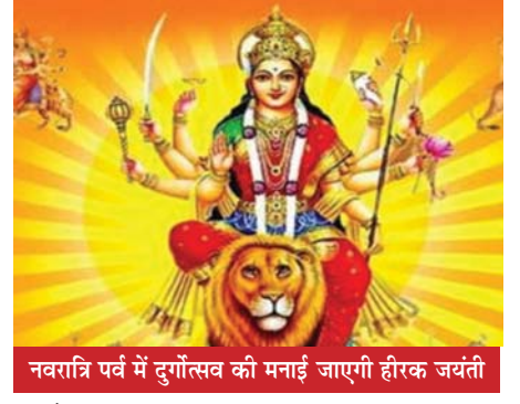
नवरात्रि पर्व में दुर्गात्सव की मनाई जाएगी हीरक जयंती