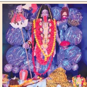
सार्वजनिक कालिका उत्सव समिति, गुड्डा लार्डन हमालपारा