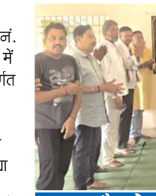
महापौर ने किया लोकार्पण

राजनांदगांव (दावा)। नगर निगम द्वारा वार्ड जं. 33 लखवली बैगा पारा में अधीसंरचना मद अंतर्गत 20 लाख रूपये की लागत से सोनकर समाज के लिये भवन का निर्माण किया गया है। जिसका आज लोकार्पण करते हुये महापौर श्रीमती हेमा सुदेश देशमुख ने कहा कि वार्ड पार्षद एवं सामाजिक बंधुओं की मांग पर निगम द्वारा 20 लाख रूपये की लागत से बना हाल, दो कमरा, शौचालय के साथ सर्वसुविधायुक्त भवन का निर्माण किया गया है। भवन निर्माण होने से समाज के लोगों को सामाजिक, धार्मिक एवं अन्य आयोजनों के लिये एक सर्वसुविधायुक्त उचित स्थान मिल गया। उन्होंने कहा कि