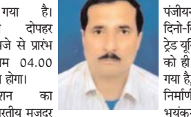
अधिवेशन दोपहर 11.30 बजे से प्रारंभ होकर शाम 04.00 बजे समाप्त होगा।

राजनांदगांव (दावा)। भारतीय मजदूर संघ से संबद्ध छत्तीसगढ़ निर्माण मजदूर महासंघ का त्रिदिवसीय अधिवेशन आगामी 06 अक्टूबर को भारतीय मजदूर संघ के प्रदेश कार्यालय न्यू चंगोरभांड रायपुर में आयोजित किया गया है।