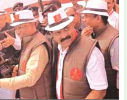
बलों का रणनीतिक कौशल दिखाएंगे। भीष्म टैंक, 950 गोलीयों दायनी वाली राइफल और 50 से ज्यादा हथियारों की प्रदर्शनी लगाई जाएगी। भारतीय सेना खुशी झंडा दिखाएगी और छत्तीसगढ़ के सांस्कृतिक कार्यक्रम का भी आयोजन हो रहा है। दत्तेवाड़ा के बच्चे सेना के साथ घुड़सवारी करेंगे। बड़ी संख्या में दर्शक साइंस कॉलेज मैदान पहुंच चुके हैं।

रायपुर (दावा)। छत्तीसगढ़ की राजधानी रायपुर में नो योर आर्मी कार्यक्रम का आगाज हो गया है। मुख्यमंत्री विष्णुदेव साय ने कार्यक्रम का शुभारंभ कर दिया है। इसी बीच सशस्त्र सैन्य समारोह में अनहोनी होने से टल गई। जहां लोहे की बैरिकेडिंग में करंट फैल गया और घोड़ा को करंट का झटका लग गया। जिसके बाद घुड़सवारों ने तत्काल बिजली कर्मचारियों बुलाकर ठीक कराया। वहीं घोड़ा ठीक बताया जा रहा है। सशस्त्र सैन्य समारोह में शामिल होने के लिए हजारों स्कूली छात्र और महिलाएं पहुंची। कड़ी धूप में सिर में छाता और स्कार्फ लगाकर लोग करतब देख रहे हैं। वहीं कड़ी धूप के बावजूद देश भक्ति गीत से बच्चे झूम रहे हैं। 500 जवान दिखाएंगे रणनीतिक कौशल इस आयोजन में लगभग 500 जवान सैन्य