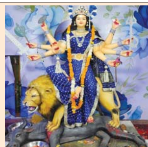
राजनांदगांव दुर्गा उत्सव समिति, वेगा गुप मानव मंदिर चौक