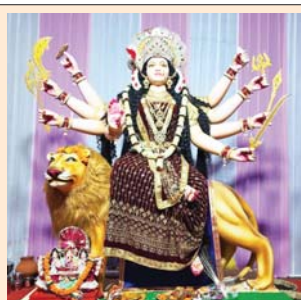
परमहंस दुर्गा उत्सव समिति, रामाधीन मार्ग