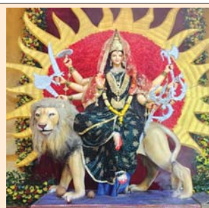
मां वैष्णोदेवी उत्सव समिति, आजाद चौक