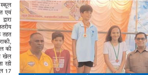
24वीं राज्य स्तरीय शालेय क्रीड़ा प्रतियोगिता

राजनांदगांव (दावा)। स्कूल शिक्षा विभाग द्वारा संचालित एवं जिला शिक्षा विभाग द्वारा आयोजित 24वीं राज्य स्तरीय शालेय क्रीड़ा प्रतियोगिता के तहत बॉस्केटबॉल, हॉकी, तैराकी, वाटरपोलो, शतरंज, बेसबॉल की प्रतियोगिता नगर के विभिन्न खेल मैदानों में आयोजित की जा रही है। जिसके तहत बॉस्केटबॉल 17 वर्ष बालिका वर्ग में बिलासपुर ने बस्तर को 9-3 अंकों से मेजबान दुर्ग ने बिलासपुर को 39-0 अंकों से बालक वर्ग में दुर्ग ने बिलासपुर को 39-11 अंकों से बिलासपुर ने बस्तर को 18-12 अंकों से 19 वर्ष बालिका वर्ग में बस्तर ने बिलासपुर को 30-0 अंकों से दुर्ग ने बिलासपुर को 33-0 अंकों से बस्तर ने बिलासपुर को 33-29 अंकों से रायपुर ने बस्तर को 46-25 अंकों से पराजित किया। दिग्विजय स्टेडियम में खेले जा रही है, बेसबॉल बालक वर्ग में दुर्ग ने सरगुजा को 13-3 अंकों