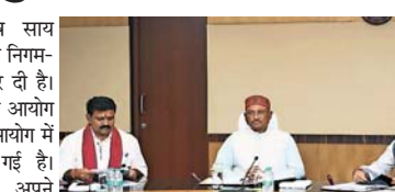
था, बाद में वह रायपुर से सांसद निर्वाचित हो गए। तबसे मंत्रिमंडल में दो सीटें रिक्त हैं। कयास लगाए जा रहे हैं कि दो विधायकों को साय की मंत्रिमंडल में जल्द ही जगह मिल सकती है। भाजपा को अभी रायपुर-दक्षिण के उपचुनाव में भी रायपुर के एक नेता को टिकट देनी है। ऐसे में निगम-मंडलों व प्राधिकरणों की सूची में भी सामंजस्य बैठया जा रहा है। प्रदेश की करीब 30 अधिक निगम-मंडलों, आयोगों में करीब 200 नियुक्तियां होंगी हैं। निगम-मंडल

रायपुर। मुख्यमंत्री विष्णुदेव साय सरकार ने प्राधिकरणों के बाद निगम-मंडलों में भी नियुक्तियां शुरू कर दी हैं। प्रदेश के पिछड़ा वर्ग आयोग, युवा आयोग के अध्यक्ष के बाद अब महिला आयोग में सदस्यों की भी नियुक्ति की गई है। जानकारी के अनुसार साय अपने मंत्रिमंडल में भी जल्द विस्तार कर सकते हैं। साय सात अक्टूबर को दिल्ली में केंद्रीय गृह मंत्री अमित शाह के साथ एक महत्वपूर्ण बैठक के बाद रायपुर लौटे हैं। इस बैठक में विकास और कल्याण संबंधी मुद्दों पर चर्चा होगी। इसके अलावा मंत्रिमंडल के विस्तार को लेकर भी चर्चा हो सकती है। प्रदेश की 90 सीटों वाली विधानसभा में 13 मंत्री के पद हैं। अभी साय सरकार में दो मंत्रियों के पद खाली हैं। रायपुर-दक्षिण के विधायक बृजमोहन अग्रवाल को शिक्षा मंत्री बनाया गया