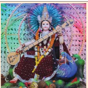
शारदा उत्सव समिति, जय स्तंभ चौक