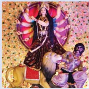
श्री दुर्गा वार्षिक उत्सव, शक्ति धाम दुर्गा चौक