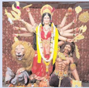
मां शीतला दुर्गा उत्सव समिति, माता देवालय सोनार पारा