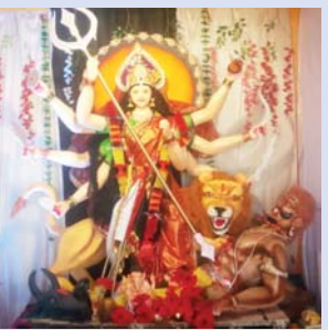
हरदी- नव दुर्गा उत्सव समिति शिव शक्ति चौक ग्राम कन्याडबरी