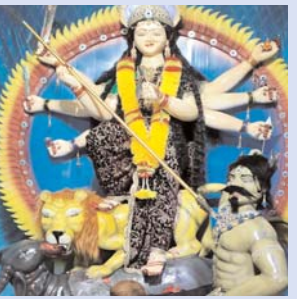
जय शारदा दुर्गा उत्सव समिति चेन्दरीवन नवागाँव