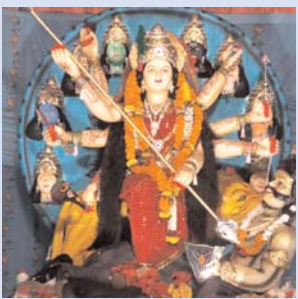
सार्वजनिक दुर्गा उत्सव समिति रविदास नगर वाई नंबर 20