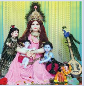
मां शारदा उत्सव समिति गोल बजार