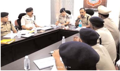
थाना प्रभारियों को आम जनता को जागरूक करने दिये निर्देश