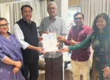
रसायन शास्त्र, शास. कमला देवी महाविद्यालय भी उपस्थित थी। इस एमओयू से महाविद्यालय की छात्राएँ एबीएस कंपनी की विभिन्न परियोजनाओं, संयुक्त रूप से विभिन्न सेमीनार एवं कॉन्फ्रेंस का आयोजन, आधुनिक लैब, सर्वर, पोल्ट्री, डेयरी आदि का समर्थन-समर्थन पर अवलोकन एवं अध्ययन कर सकेंगी, साथ ही भविष्य में निकलने वाले रोजगार अवसर का भी लाभ उठा पायेंगी।