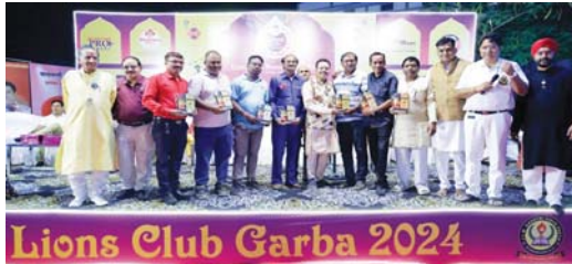
Lions Club Garba 2024