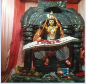
सरस्वती समिति स्कूल मैदान चोक