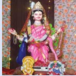
बाल सरस्वती समिति तिरंगा चोक