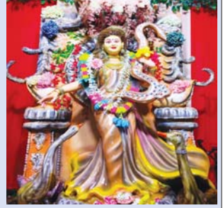
हॉस्पिटल चोक घुमका