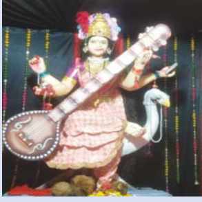
नव सरस्वती समिति अखराभाडा चोक