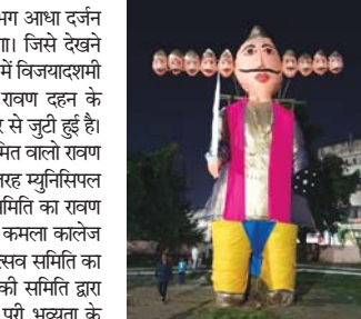
लखौली स्कूल मैदान में जलेगा 51 फीट का रावण, लोक सांस्कृतिक कार्यक्रम की होगी प्रस्तुति

कटक की आतिशबाजी साहित, म्यूजिक माफिया बैंड की होगी रंगारंग सिंगिंग-डांसिंग की प्रस्तुति