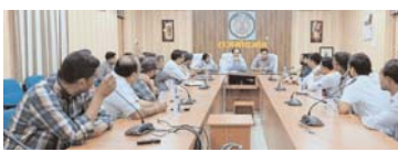
अधिकारियों को दिए। पुलिस अधीक्षक मोहित गंग ने दशहरा कार्यक्रम के लिए जारी पास में गेट नंबर आवश्यक दिशानों को साउंड सिस्टम को एक निर्धारित दूरी पर रखने कहा, जिससे सभी को एक जैसे डेसिबल में साउंड मिल सके। उन्होंने दशहरा आयोजन समितियों को पर्याप्त मात्रा में वालंटियर रखकर उन्हें सेक्टर आर्बाइट करने के निर्देश दिए। जिससे सारी व्यवस्था अच्छे से हो सके। कलेक्टर ने मां दुर्गा की प्रथमा विसर्जन के संबंध में दुर्गा उत्सव समितियों से जानकारी ली। उन्होंने मोहारा स्थित विसर्जन कुंड की साफ-सफाई, सेंट, गोताखोर और लाईट की समुचित व्यवस्था करने के निर्देश

राजनांदगांव (दावा)। कलेक्टर संजय अग्रवाल एवं पुलिस अधीक्षक मोहित गंग ने मां दुर्गा की प्रथमा विसर्जन एवं दशहरा आयोजन के संबंध में दुर्गा उत्सव समिति और दशहरा उत्सव समितियों की बैठक ली। कलेक्टर संजय अग्रवाल ने कहा कि संस्कारधानी राजनांदगांव बहुत बढ़िया शहर है। उन्होंने दशहरा उत्सव समितियों को संस्कारधानी के अनुरूप ही कार्यक्रम आयोजित करने कहा। दशहरा आयोजन समितियों को सुरक्षा के सभी आवश्यक व्यवस्था करने के निर्देश दिए। उन्होंने बैटन व्यवस्था, पाकिंग व्यवस्था, बेरिफेटींग, एम्बुलेंस, फायर बिडो की व्यवस्था रखने के निर्देश दिए। उन्होंने कहा कि शॉर्ट सर्किट से बचने के लिए पहले से विद्युत व्यवस्था को अच्छे