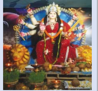
मां शीतला दुर्गा समिति बड़े चौरा चोक