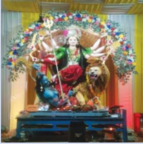
नव ज्योति मंडल समिति मां कर्मा चोक