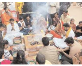
नौ-कन्याओं का पूजन यज्ञ-हवन के साथ ही आज नौ-कन्या पूजन की धूम रहेगी। इसी के साथ भोज-भंडारा कार्यक्रम भी सम्पन्न किए जाएंगे। कन्या पूजन के लिए आज दो-तीन वर्ष से लेकर दस-बारह वर्ष के नव कन्याओं की खासी मांग बनी रहेगी। नवरात्रि के नौ दिनों तक मातारानी की जप-तप, साधना उपासना करने वाले भक्त जन व दुर्गा पूजन समिति वाले भी हवन-पूजन पंथात नौ कन्या पूजन व महाप्रसादी कार्यक्रम में जुटे रहेंगे। नौ-कन्याओं को बुला कर तथा उन्हें आसन में बिठाकर बड़े प्यार से उनका चरण पखारा जाएगा तब तक उनके पेट में मातारानी की तरह साज श्रृंगार

आज शहर के गायत्री शक्तिपीठ सहित पाताल भैरवी मंदिर, माता देवाला शीतला मंदिर, सुनार पारा, काली माई मंदिर भक्तापारा, महामाई मंदिर कसाई पारा, चंडी मंदिर लखौली नाका, फिरतीन माता मंदिर नंदई व बसंतपुर सहित अन्यान्य देवी मंदिरों में हवन-पूजन का कार्यक्रम आयोजित रहेगा। लोग अपनी श्रद्धानुसार मातारानी में फल-फूल नारियल व प्रसादी चढ़ाकर यज्ञ-हवन के कार्यक्रम में भाग लेंगे व भक्त जनों द्वारा देवी मां को यज्ञाहुति प्रदान कर अपने घर परिवार की खुशहाली सुख शांति व समृद्धि की दुआएं मांगी जाएगी। बता दें कि नौ-रात्रि के नौ-दिनों तक मां