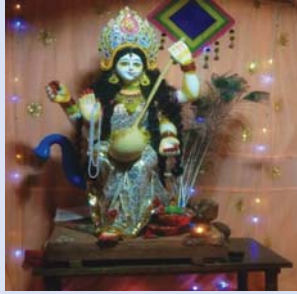
नवयुवक सरस्वती समिति टाकुर चोक