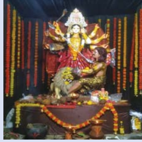
सरस्वती भजन समिति दुर्गा चोक