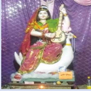
बालक सरस्वती समिति धान मंडी चोक