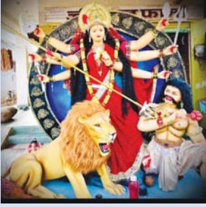
नवयुवक समिति चण्डी चोक