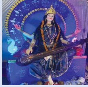
विश्वास सरस्वती समिति कुआं चोक