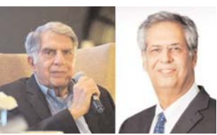
पहले ही दो फैमिली ट्रस्ट में शामिल, पारसी कम्प्युनिटी की पसंद; कहा- विरासत को आगे बढ़ाऊंगा

मुंबई। 66 साल के नोएल टाटा अब 'टाटा ट्रस्ट' के चेयरमैन होंगे। वे पहले ही दो फैमिली ट्रस्ट के ट्रस्टी हैं। नोएल रतन टाटा के सौतेले भाई हैं। 9 अक्टूबर को रतन टाटा के निधन के बाद नोएल इकलौते दावेदार थे। हालांकि उनके भाई जिम्मी का नाम भी चर्चा में था, लेकिन वे पहले ही रिटायर हो चुके हैं। मुंबई में ट्रस्ट की मीटिंग में नोएल के नाम पर सहमति बनी। टाटा ट्रस्ट ने आधिकारिक बयान में कहा, 'उनकी नियुक्ति तत्काल प्रभाव से लागू होगी।' नोएल टाटा ने कहा मेरे साथी ट्रस्टियों ने मुझे जो जिम्मेदारी दी है, उससे मैं बहुत सम्मानित महसूस कर रहा हूँ। मैं रतन टाटा और टाटा ग्रुप के संस्थापकों की विरासत को आगे बढ़ाने के लिए उत्सुक हूँ। एक सदी से भी पहले स्थापित, टाटा ट्रस्ट सामाजिक भलाई के काम करने का एक यूनिक माध्यम है। हम परोपकारी पहल को आगे बढ़ाने और राष्ट्र निर्माण में अपनी भूमिका निभाने के लिए खुद को फिर से समर्पित करते हैं। नोएल नवल टाटा की दूसरी पत्नी सिमोन के बेटे हैं। वहीं रतन टाटा और जिम्मी टाटा नवल