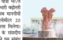
अर्थात 20 रुपये प्रति किलोमीटर कर दिया है।

रायपुर। छत्तीसगढ़ के विधायकों के यात्रा भत्ते में सरकार ने भारी बढ़ोतरी कर दी है। अब माननीयों को प्रति किलोमीटर 20 रुपये यात्रा भत्ता मिलेगा। राज्य सरकार के संसदीय कार्य विभाग ने इस संबंध में अधिसूचना जारी कर दी है। उल्लेखनीय है कि, इससे पहले तक छत्तीसगढ़ के विधायकों को यात्रा भत्ता प्रति किलोमीटर 10 रुपये के हिसाब से मिलता था। लेकिन अब राज्य सरकार ने इसे सीधे दोगुना