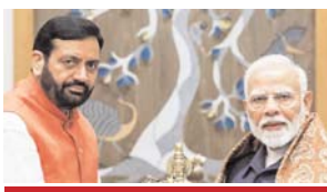
पीएम मोदी समेत कई दिग्गज नेता होंगे शामिल

हरियाणा। हरियाणा के नए मुख्यमंत्री का शपथ ग्रहण समारोह 15 अक्टूबर को होगा। इसमें नाथ सिंह सेनी दूसरी बार सीएम पद की शपथ लेंगे। हालांकि, अभी इसका औपचारिक ऐलान नहीं हुआ है। वहीं सीएम के समारोह को लेकर पंचकूला के डीसी की अगुवाई में एक कमेटी का गठन किया गया है, जिसमें 10 सदस्य होंगे। इस कार्यक्रम में पीएम मोदी, अमित शाह और राजनाथ सिंह समेत कई राज्यों के मुख्यमंत्रियों शामिल हो सकते हैं।