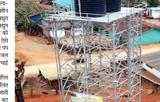
सोलर इयूल पंप से अब गांवों में मिल रहा है शुद्ध पेयजल

मोहला (दावा)। जिला-मोहला-मानपुर-अं.चौकी के ऐसे पहुंचे विहीन वनांचल तथा दुर्गम ग्राम जहां विद्युत प्रदाय न होने अथवा सहुम विद्युत आपूर्ति न होने के कारण विद्युत पंप की स्थापना किया जाना संभव नहीं था। ऐसे स्थलों पर क्रेड के द्वारा सोलर इयूल पंप की स्थापना का कार्य वर्तमान में जल जीवन मिशन योजनांतर्गत ऊंचाई 12/09 मीटर किया जा रहा है।