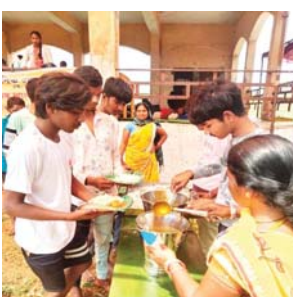
एबीसग्रुप टेकाहरी ने संस्कारधानी में सम्प्रदायिक सद्भाव का उत्कृष्ट उदाहरण दिया

टेकाहरी (दावा)। शारदीय कुंवारा नवरात्र में माँ बन्देश्वरी के पदयात्रियों की मुस्लिम समुदाय भी सेवा कर रहे हैं। टेकाहरी स्थित एबीस ग्रुप के पंडाल में आपसी भाईचारे का संदेश लिए मुस्लिम धर्मालंबी पदयात्रियों की आवभगत में कोई कसर नहीं छोड़ रहे हैं। एक ओर हिन्दू समुदाय शारदीय नवरात्र पर्व के भक्ति में लीन है तो पांच वक्त की नमाज अदा करते मुस्लिम पदयात्रियों की सेवा सुत्कार में डूबे हुए हैं।