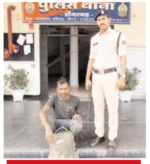
सायबर सेल राजनांदगांव एवं डोंगरगाड़ पुलिस को चोरी के अंतर्राज्यीय चोर को पकड़ने में मिली सफलता