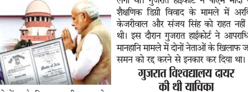
उन्होंने मामले में उनके खिलाफ जारी समन को रद्द करने की मांग की थी। दोनों राजनेताओं ने गुजरात विश्वविद्यालय द्वारा दायर मामले में एक ट्रायल कोर्ट द्वारा जारी किए गए समन और सत्र अदालत के समन के खिलाफ उनकी पुनरीक्षण याचिका को खारिज करने के आदेश को उच्च न्यायालय में चुनौती दी थी।