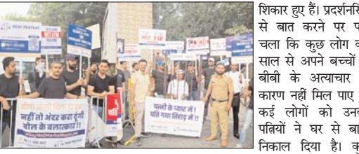
शिकार हुए हैं। प्रदर्शनरियों से बात करने पर पता चला कि कुछ लोग कई साल से अपने बच्चों से बीबी के अत्याचार के कारण नहीं मिल पाए हैं। कई लोगों को उनकी पत्नियों ने घर से बाहर निकाल दिया है। कुछ निकाह नहीं देती हैं। कुछ पति ऐसे हैं जो अपना घर छोड़ते हुए भी किराए के मकानों में रहने के लिए मजबूर हैं।

नई दिल्ली। जवाहर लाल नेहरू स्टेडियम के बाहर (21 अक्टूबर) को एक ऐसा प्रदर्शन हुआ, जिसने सबका ध्यान अपनी ओर खींचा। यहां पत्नी प्रताड़ित लोगों ने प्रदर्शन किया। प्रदर्शनकारियों ने अपने हाथों में तरह-तरह के स्लोगन लिखी तख्तियां लहराईं और नारे लगाए। दरअसल ये लोग मैरिटल रेप को लेकर प्रस्तावित कानून का विरोध कर रहे थे। प्रदर्शनकारियों ने विरोध प्रदर्शन के दौरान इस तरह के नारे लगाए -