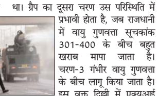
था। ग्रेप का दूसरा चरण उस परिस्थिति में प्रभावी होता है, जब राजधानी में वायु गुणवत्ता सूचकांक 301-400 के बीच बहुत खराब मापा जाता है। चरण-3 गंभीर वायु गुणवत्ता के बीच लागू किया जाता है। इस चक्र दिल्ली में एक्यूआई योजना का अंतिम और चरण-4 गंभीर + वायु गुणवत्ता की परिस्थिति में लागू किया जाता है।

नई दिल्ली। दिल्ली-एनसीआर में प्रदूषण के बढ़ते स्तर को देखते हुए ग्रेड रिस्पांस एक्शन प्लान (ग्रेप) का दूसरा चरण लागू कर दिया गया है। इसके तहत डीजल जनरेटर और तंदूर में कोयले पर पाबंदी रहेगी। वाहन पार्किंग की फीस में भी बढ़ोतरी की जाएगी। वायु गुणवत्ता प्रबंधन आयोग ने सोमवार को वायु गुणवत्ता को देखते हुए यह फैसला किया।