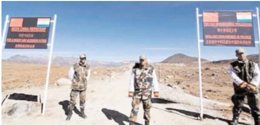
इससे गलवान जैसे टकराव को टाला जा सकेगा।

नई दिल्ली। प्रधानमंत्री नरेंद्र मोदी की ब्रिक्स समिट में शिरकत से पहले भारत और चीन के बीच बड़ा समझौता हुआ है। दोनों देश लाइन ऑफ एंक्लाव कंट्रोल पर पेट्रोलिंग के लिए सहमत हो गए हैं। इससे पूर्वी लद्दाख में दोनों देशों के बीच सीमा विवाद सुलझ सकता है और टकराव में कमी आएगी।