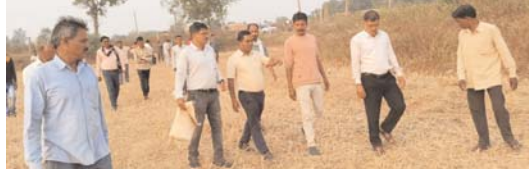
एक किसान के रास्ता बंद करने से सैकड़ों किसान प्रभावित

डोंगरगाँव (दावा)। ग्राम दीवानझिटिया के किसानों के खेत पहुंच मार्ग बाधित होने की सूचना के बाद प्रशासनिक अधिकारियों ने सुध लेते हुए त्वरित निराकरण के लिए मौके पर पहुंचकर सीमांकन कार्य प्रारंभ किया है। बता दें कि 19 नवंबर मंगलवार को ग्राम दीवानझिटिया के सैकड़ों किसान अपने परिवार के साथ अपनी समस्या को लेकर एसडीएम कार्यालय डोंगरगाँव पहुंचे थे। किसानों ने अपने आवेदन में बताया कि एक किसान ने अपनी जमीन में घेरा कर उनके खेत पहुंच मार्ग को अवरुद्ध कर दिया है, चूंकि यह जमीन मुख्य मार्ग से