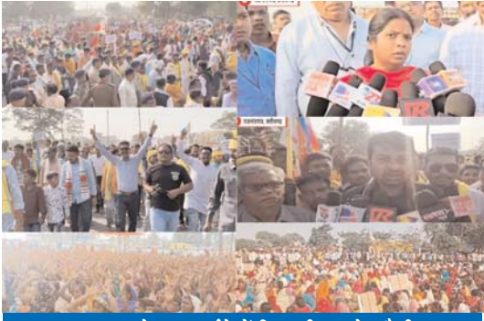
सभा कर नेशनल हाईवे में निकाली आक्रोश रैली

छुरिया (दावा)। जिले के छुरिया ब्लॉक में आने वाले बम्हनी चारभाठा, गैदाटोला, कुमरदा, तीनों जिला पंचायत क्षेत्र और नगर पंचायत छुरिया को एसटी आरक्षण करने की मांग सहित छ.ग. शासन में बैठे विष्णुदेव साय कैबिनेट बैठक में 2024 के त्रिस्तरीय पंचायत व नगरीय निकाय चुनाव में ओबीसी को 50 प्रतिशत आरक्षण देने पर एवं अनुसूचित जनजाति (एसटी) को वर्तमान में बिना सर्वे 2001, 2011 अनुसार आधार मानकर राजनांदगांव जिले में महज 20 से 24 प्रतिशत आरक्षण दिये जाने को लेकर सर्व आदिवासी समाज ने शासन और प्रशासन के खिलाफ सभा कर आक्रोश रैली निकाली, सभा का आयोजन जिले के ग्राम बापुटोला (चिचोला) में हुआ जिसमें हजारों हजार सर्व आदिवासी समाज के लोग उपस्थित थे, जहां आदिवासी समाज प्रमुखों ने सभा को संबोधित करते हुए विष्णुदेव सरकार और प्रशासन पर खूब बरसे, सभा पश्चात