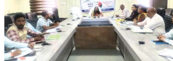
हितग्राही मूलक योजनाओं के क्रियान्वयन में अपेक्षित प्रगति में कमी पर संबंधित अधिकारी पर होगी अनुशासनात्मक कार्रवाई