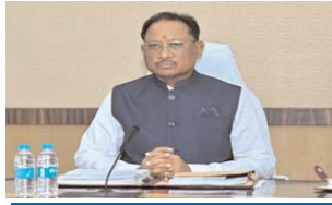
सम्मेलन के समापन सत्र को मुख्यमंत्री डॉ. जितेन्द्र सिंह करेंगे संबोधित

रायपुर (दावा)। 'सुशासन' के माध्यम से लोगों को सशक्त बनाकर प्रधानमंत्री के सुशासन के दृष्टिकोण को लागू करने के उद्देश्य से प्रशासनिक सुधार एवं लोक शिकायत विभाग (डीएआरपीजी), कार्मिक, लोक शिकायत एवं पेंशन मंत्रालय, भारत सरकार द्वारा छत्तीसगढ़ शासन के सहयोग से 21 से 22 नवंबर तक होटल फेयरवे, अटल नगर, नवा रायपुर में 'सुशासन' पर दो दिवसीय क्षेत्रीय सम्मेलन का आयोजन किया जा रहा है। इस सम्मेलन के समापन सत्र को छत्तीसगढ़ के मुख्यमंत्री, विष्णुदेव साय और केन्द्रीय राज्यमंत्री (कार्मिक) डॉ. जितेन्द्र सिंह संबोधित करेंगे।