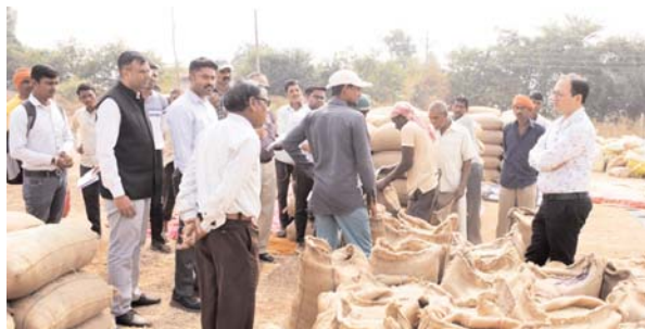
नोडल अधिकारी प्रतिदिन धान उपार्जन केन्द्रों में करें भौतिक सत्यापन

बायोमेट्रिक डिवाइस मशीन, मानव संसाधन सहित अन्य व्यवस्थाओं के साथ-साथ आर्द्रतामापी यंत्र के संबंध में जानकारी ली। कलेक्टर ने धान उपार्जन केन्द्र तुमड़ीबोड़ पहुंचकर धान विक्रय के लिए उपस्थित किसानों से चर्चा कर प्रशासन द्वारा धान उपलब्ध कराई गई सुविधाओं के संबंध में जानकारी ली। किसानों ने बताया कि इस वर्ष कई स्थानों पर माहो कीट इत्यादि लगने के कारण उत्पादन में कुछ कमी आई है, कलेक्टर ने कहा कि किसान इन उपार्जन केन्द्रों में अपने वास्तविक उपज का विक्रय सुनिश्चित करें। उन्होंने समिति प्रबंधकों को कहा कि धान उपार्जन केन्द्र में किसी भी कोचियों एवं बिचौलियों से अवैध धान की खरीदी-बिक्री नहीं होनी चाहिए। ऐसा होने पर सख्त कार्रवाई करने के लिए अधिकारियों को निर्देशित किया है। उन्होंने धान उपार्जन केन्द्र में महिलाओं कृषकों के लिए अस्थाई शौचालय बनाने के