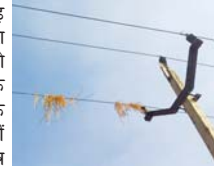
डोंगरगढ़, मोहला, खैरागढ़, छुरिया, डोंगरगांव एवं राजनांदगांव के ग्रामीण इलाकों में धान मिसाई के कारण विद्युत लाइनों में ब्रेकडाउन की आ रही है शिकायतें

राजनांदगांव (दावा)। छत्तीसगढ़ स्टेट पावर डिस्ट्रीब्यूशन कंपनी द्वारा विद्युत लाइनों में आ रही व्यवधान को दृष्टिगत रखते हुये समस्त कृषक उपभोक्ताओं से विद्युत लाइनों के निकट धान मिंजाई के कार्य को नहीं करने की अपील की गई है। गौरतलब है कि किसानों के द्वारा अपने धान के फसलों की कटाई कर मिसाई के कार्य को कराया जा रहा है। इस दौरान खेत खलियानों में विद्यमान विद्युत लाइनों के नीचे धान फसल की मिंजाई का कार्य श्रेसर मशीन के माध्यम से कर रहे हैं, धान मिंजाई से उड़ने वाला पत्रा/भूसा विद्युत लाइनों में चिपक कर रात में ओस आने के कारण नमी से लाइनों में फेस टूट फेस संपर्क होने से विद्युत लाइनों में व्यवधान उत्पन्न हो रहे हैं जिससे निर्बाध विद्युत व्यवस्था बनाये रखने में अनेक कठिनाईयों का सामना करना पड़ रहा है। इसी के मद्देनजर विद्युत विभाग द्वारा किसानों से जागरूकता