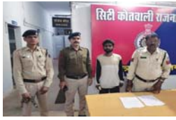
गिरफ्तार कर भेजा गया जेल

राजनांदगांव (दावा)। सिटी कोतवाली पुलिस ने अपने थाना क्षेत्र में आदतन तथा फरार आरोपी को गिरफ्तार कर जेल भेज दिया है।