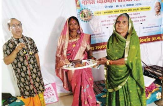
दो दिवसीय आयोजन में 27 मंडलियों ने लिया हिस्सा