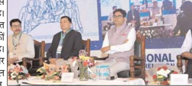
वित्त मंत्री ने सुशासन पर आयोजित क्षेत्रीय सम्मेलन का किया शुभारंभ

रायपुर (दावा)। सुशासन विकास के लिए एक महत्वपूर्ण कारक है। इससे न केवल देश का सुव्यवस्थित विकास होता है, बल्कि यह नागरिकों के जीवन को भी बेहतर बनाता है। प्रधानमंत्री नरेन्द्र मोदी की पहल पर प्रारंभ हुए स्वच्छ भारत मिशन, जल जीवन मिशन, जीएसटी, जैम पोर्टल, डिजिटल इनक्लुजन जैसे नवाचारों ने देश में बड़ा बदलाव लाया है। वित्त मंत्री ओ.पी. चौधरी ने आज नवा रायपुर में केन्द्रीय कार्मिक, लोक शिकायत एवं पेंशन मंत्रालय के प्रशासनिक सुधार और लोक शिकायत विभाग तथा छत्तीसगढ़ शासन के सुशासन एवं अभिसरण विभाग द्वारा आयोजित क्षेत्रीय सम्मेलन का शुभारंभ करते हुए ये विचार व्यक्त किए। छत्तीसगढ़ सहित देशभर से आए भारतीय प्रशासनिक सेवा और केन्द्रीय कार्मिक, लोक शिकायत एवं पेंशन मंत्रालय के अधिकारी सम्मेलन में सुशासन के लिए किए जा रहे नवाचारों, बेस्ट प्रैक्टिस और जनोन्मुखी कार्यों पर विमर्श कर रहे हैं। नागरिक केन्द्रित सुशासन पर आयोजित दो दिवसीय क्षेत्रीय सम्मेलन के उद्घाटन सत्र को संबोधित करते हुए वित्त मंत्री ओ.पी. चौधरी ने कहा कि वर्ष 2047 तक भारत को 55 ट्रिलियन डॉलर की अर्थव्यवस्था बनाने में ब्यूरोक्रेट्स की महत्वपूर्ण होगी। उन्होंने सम्मेलन में भागीदारी कर रहे विभिन्न राज्यों के भारतीय प्रशासनिक सेवा के अधिकारियों से कहा कि सुशासन, नवाचार और बदलाव के लिए खुद को ट्रांसफॉर्म करना होगा, ताकि आप लोगों की प्रतिभा और व्यक्तित्व में क्षरण न हो। समय के साथ स्वयं को बदलने वाले ही प्रसंगिक रहेंगे। श्री चौधरी ने कहा कि भारत की अर्थव्यवस्था तेजी से बढ़ रही है। प्रधानमंत्री नरेन्द्र मोदी के नेतृत्व और सुशासन से वर्ष