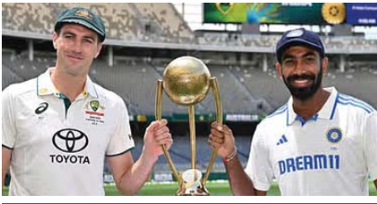
बुमराह और अश्विन के पास गोल्डन चांस, खतरे में कपिल देव और अनिल कुंबले का महारिकॉर्ड

नई दिल्ली। बॉर्डर-गावस्कर ट्रॉफी का कल यानी 22 नवंबर से आगाज होगा। ऑस्ट्रेलिया के खिलाफ पर्यटन में खेलने वाले पहले टेस्ट मैच में तेज गेंदबाज जसप्रीत बुमराह भारतीय टीम की कप्तानी करते नजर आएंगे। इस मैच में जसप्रीत बुमराह का मुकाबला तेज गेंदबाज पैट कैमिंस की कप्तानी वाली मजबूत ऑस्ट्रेलिया से होगा। इस तरह टेस्ट क्रिकेट के इतिहास में छठी बार ऐसा होगा जब 2 तेज गेंदबाज एक ही टेस्ट मैच में कप्तानी करते दिखाई देंगे। भारतीय टीम को वर्ल्ड टेस्ट चैंपियनशिप के फाइनल में अपनी जगह पक्की करने के लिए बॉर्डर-गावस्कर ट्रॉफी के 5 मैचों में कम से कम 4 मैच जीतने होंगे। ऐसे में जसप्रीत बुमराह के कंधों पर ऑस्ट्रेलिया के बल्लेबाजों को