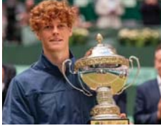
फाइनल में नीदरलैंड को 2-0 से हराया

हराकर इटली को 1-0 की बढ़त दिलाई थी। सिनर ने जीत के बाद कहा, गत विजेता होकर एक बार फिर चैंपियन बनना, हमारे लिए इससे अच्छी भावना और कोई नहीं हो सकती है। पलासियो डि डिपोर्टस जोस खिताब से मालिया माउसिन काफेना में बैठे 9 हजार दो सी दर्शकों में इटली को जबदस्त सभ्यता मिली। के इटली के समर्थकों ने मेगा सिनर ने टैलन ग्रीकस्पोर को सीधे सेटों में 7-6 (2), 6-2 से हराकर इटली को विजेता बनाया। इससे पहले मैटियो बेरेट्टिनी ने गफेल नखल को उनके अंतिम मुकामबले में हराने वाले बोटिक वान डि जेडशुल्क को 6-4, 6-2 से