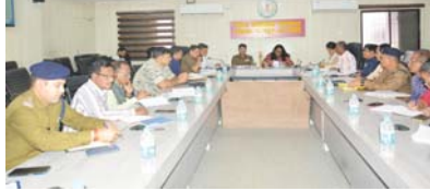
अवैध शराब परिवहन, भंडारण, विक्रय पर करें कड़ी कार्रवाई

मोहला (दावा)। कलेक्टर श्रीमती तुलिका प्रजापति एवं पुलिस अधीक्षक यशपाल सिंह ने जिला कार्यालय के सभाकक्ष में कानून व्यवस्था से संबंधित अधिकारियों की बैठक लेकर जिला के संपूर्ण सीमा क्षेत्र में कानून व्यवस्था बनाए रखने के संबंध में आवश्यक दिशा निर्देश दिए। कलेक्टर ने अधिकारियों को निर्देशित करते हुए कहा कि जिले के अंदर शांति एवं कानून व्यवस्था बनाए रखने के लिए अधिकारीगण संवेदनशीलता के साथ कार्य करते हुए सदिग्ध गतिविधियों पर नजर रखें। उन्होंने कहा कि ऐसा कोई भी स्थिति जिससे कानून व्यवस्था का उल्लंघन होने की आशंका निर्मित हो, वह संतर्कता से कार्य करते हुए स्थिति नियंत्रण में रखने और कानून व्यवस्था बनाए रखने के लिए आवश्यक पहल करें। पुलिस अधीक्षक यशपाल सिंह ने अधिकारियों को निर्देशित करते हुए कहा कि कानून व्यवस्था का उल्लंघन होने एवं अप्रिय स्थिति निर्मित होने में मुख्य रूप से अवैध शराब मुख्य कारण होता है। उन्होंने जिले के सीमा क्षेत्र के अंदर सभी प्रकार के अवैध शराब के भंडारण, परिवहन और विक्रय पर कड़ी से कड़ी कार्रवाई करने के निर्देश दिए हैं। कलेक्टर ने पुलिस, राजस्व, आबकारी विभाग के अधिकारियों को निर्देशित करते हुए कहा महाराष्ट्र सीमा से होकर आने वाले अवैध शराब पर कड़ी नजर रखें। उन्होंने जिले के अंतर्गत शराब का अवैध व्यापार करने वाले कोचियों का नाम पता की सूची प्रत्येक थाना स्तर पर तैयार रखने के निर्देश दिए हैं। पुलिस अधीक्षक श्री सिंह ने कहा कि विद्यार्थी जीवन के लिए अनुशासित होना अति अनिवार्य है। उन्होंने स्कूल, कॉलेज एवं