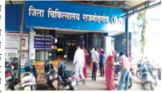
सुपरवाइजर द्वारा ठेका कर्मियों को कागज में करवाया गया दस्तखत

राजनांदगांव (दावा)। शा. जिला अस्पताल बसंतपुर में मेडस कंपनी के सुपरवाइजर द्वारा वहां के ठेका कर्मियों के साथ किए जा रहे शोषण का मामला काफी गंभीर है। बताया कि जिला अस्पताल में काम करने वाले बड़ी संख्या में कर्मचारी महिलाएं व सुस्था कर्मचारी मेडस कंपनी के सुपरवाइजर के व्यवहार व मनमानी सहित पक्षपात रवैये से तंग आकर उसके खिलाफ मोर्चा खोले हुए हैं। इससे डरे हुए सुपरवाइजर द्वारा कलेक्टर से लेकर श्रम विभाग में उनकी शिकायत करने वाले महिला कर्मचारियों को सुस्था कर्मचारियों को एक कागज में दस्तखत करा कर उन्हें काम से निकालने की धमकी दी जाने की बात सामने आ रही है। इससे कर्मचारियों में सुपरवाइजर के प्रति काफी आक्रोश देखा जा रहा है। सूत्रों की माने तो मंगलवार को मेडिकल कॉलेज हॉस्पिटल के मेडस कंपनी के सुपरवाइजर जिला चिकित्सालय पहुंचकर, डॉक्टरों से मिलकर मामले को आगे और न बढ़ाने के लिए कवायद करते देखे गए। बता